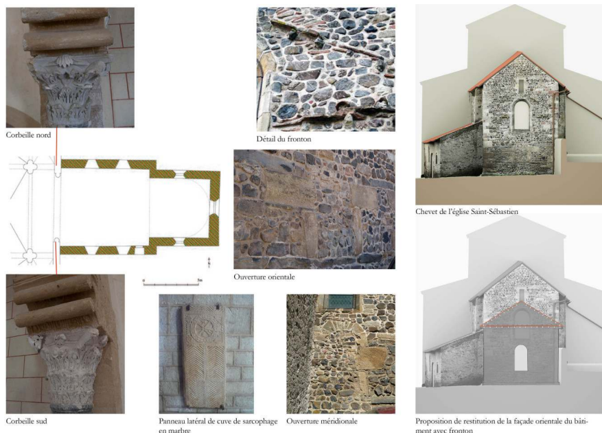
Fig. 3 – Le chevet de l'église Saint-Sébastien de Manglieu, Puy-de-Dôme

Cl. et dessin D. Martinez, 2015 ; relevés lasergrammétrique et orthophotographie du chevet O. Veissière, 2016.