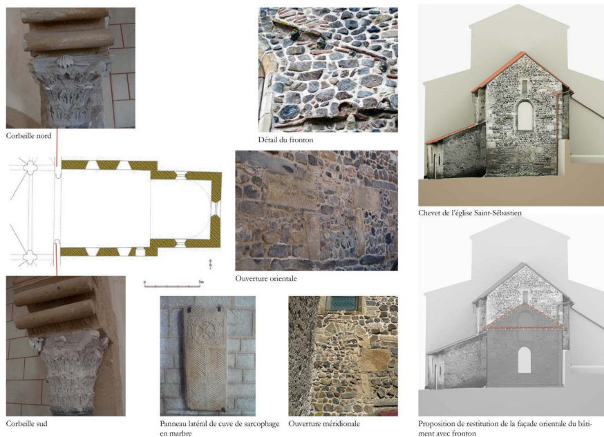
Fig. 3 – Le chevet de l'église Saint-Sébastien de Manglieu, Puy-de-Dôme

Cl. et dessin D. Martinez, 2015 ; relevés lasergrammétrique et orthophotographie du chevet O. Veissière, 2016.