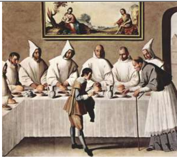
Saint Hugues au réfectoire des Chartreux (Séville, Musée des beaux-arts), Francisco de Zurbarán réalisé (1630-1635)

de toute viande et certaines communautés chrétiennes ont gardé l'habitude de s'abstenir du sang des animaux et ne consomment de viandes que bien cuites.