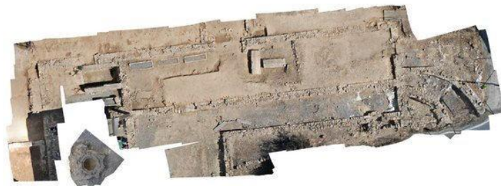
Fig. 4. Basilica di Capo Don: ortofoto

Senza entrare nel dettaglio delle variazioni delle varie fasi della basilica, che non è l'oggetto centrale di questo articolo, va senz'altro però evidenziata un'importante e precocissima modifica, l'utilizzo cioè a scopo funerario della navata nord della chiesa e del settore nord del narcece. Molti elementi portano a ritenere che questa modifica sia stata introdotta entro un brevissimo spazio di tempo dalla fondazione della chiesa, e ciò nonostante all'esterno della chiesa, almeno a Sud di essa (come ricordato nella “cronaca” del Canonico Lotti) si estendeva un vasto sepolcreto 16 .