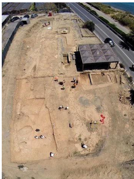
Fig. 2. Panoramica del sito di Capo Don, foto da drone

Il sito si trova su una fascia costiera pianeggiante la cui ampiezza in antico non è facile oggi da calcolare: l'attuale linea di costa infatti è più ampia di quella antica, frutto delle sistemazioni in occasione della realizzazione della ferrovia alla fine dell'800. E' probabile che la piana di Capo Don in origine fosse larga un centinaio di metri, oltre i quali progressivamente risaliva di quota per altri 200 metri verso nord, fino ad incontrare la parete dell'altura di Monte Grange.