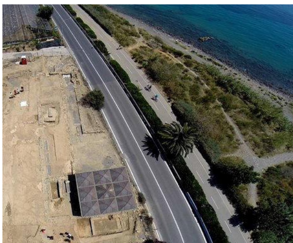
Fig. 3. Basilica di Capo Don e Via Aurelia, foto da drone

L'edificio di culto paleocristiano venne alla luce per la prima volta nel 1839, quando nel corso dei lavori per l'allargamento della sede stradale della moderna via Aurelia vennero in luce i primi muri della basilica. Delle operazioni fornisce un prezioso resoconto il canonico della vicina Taggia, Vincenzo Lotti, che spedì all'Accademia Reale delle Scienze di Torino (al Presidente, Conte Annibale di Saluzzo) una prima notizia dei ritrovamenti nel 1839 e un manoscritto più corposo nell'Ottobre del 1840.