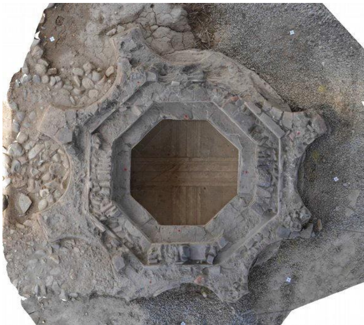
Fig. 5. Basilica di Capo Don, fonte battesimale: ortofoto.

cristianizzazione del territorio, infatti, per una serie di validissimi motivi il vescovo di Albenga scelse questo luogo per fondare una grandiosa basilica nella quale fosse assicurata la cura animarum di un vastissimo territorio. Se si considera infatti che nulla fino a questo momento consente di ipotizzare la presenza di una diocesi a Ventimiglia prima della seconda metà del VII secolo, la basilica di Capo Don era il più occidentale “avamposto” della chiesa nella Liguria bizantina. E qui la cura delle anime era dunque assicurata dalla triplice funzione della basilica: utilizzata per le ordinarie funzioni liturgiche, essa svolgeva inoltre la funzione battesimale e quella funeraria.