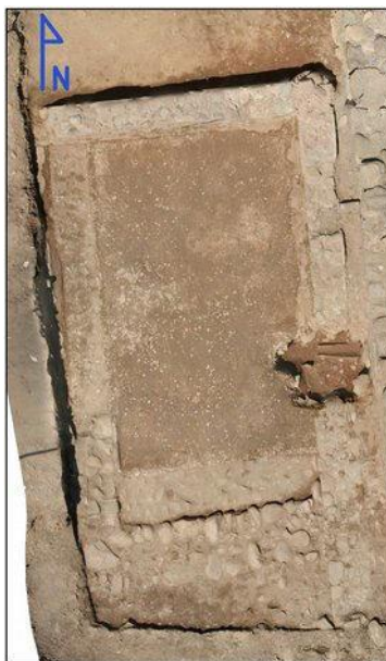
Fig. 6. Scavo di Capo Don, ambiente F: ortofoto

di scavo, preservato per le future indagini archeologiche. Ad una prima analisi preliminare, si tratta di tessere grigiastre, di colore piuttosto chiaro, abbastanza grandi.