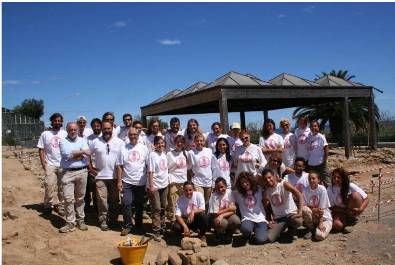
Fig. 1. L'Equipe di Riva Ligure