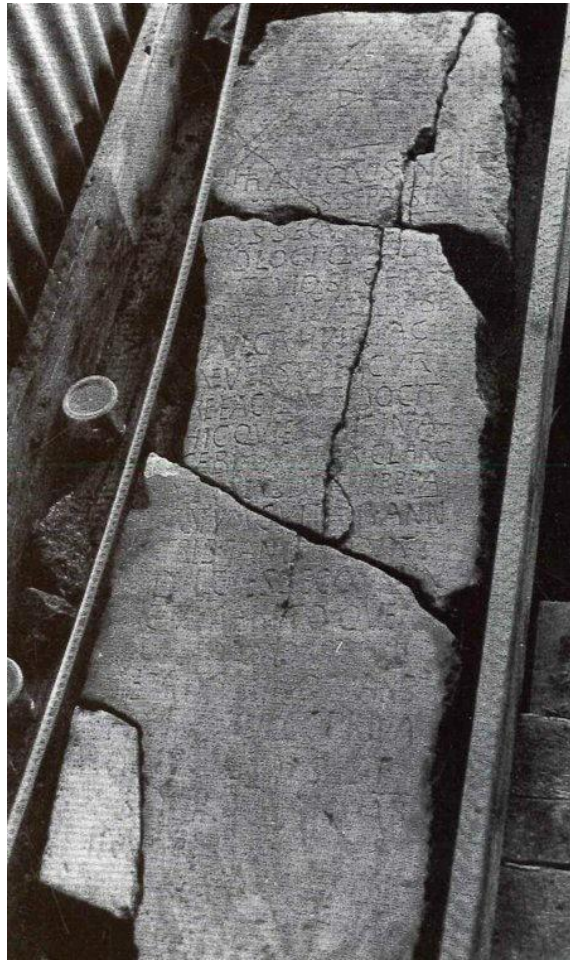
Fig. 9 - Basilica di Capo Don. Iscrizione funeraria altomedievale riutilizzata nel pavimento del vano Nord del nartece (da Pergola et al. 1989, fig. 11)

marito. La morte l'ha colta a soli XVII (o forse XXII anni ), fu deposta nel mese di gennaio" 40 .