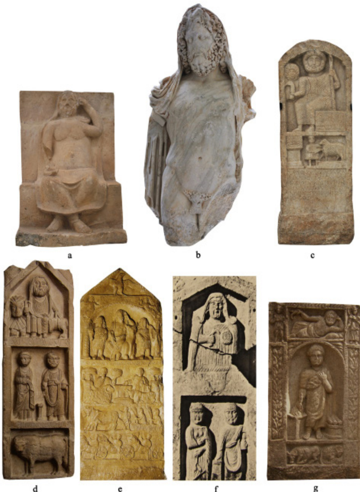
FIG. 4 : Le type iconographique du « Saturne africain » : a , statuette, (calcaire, h. 0,5 m), temple de Saturne d' Ammaedara , III e siècle apr. J.-C. (cl. B. D'Andrea, crédit : Musée national du Bardo) ; b , statue (marbre, h. 1,14 m), Sousse, région de la ville dite « des recasements Sud », II e siècle apr. J.-C. (cl. B. D'Andrea, crédit : Musée archéologique de Sousse) ; c , stèle votive dédiée à Saturne (grès, h. 1,15 m), El Ayaïda, 323 apr. J.-C. (Ben Younès H., 1995 : 200 ; cl. Ch. Walter, Paris-Musées 1995) ; d , stèle dédiée à Saturne (calcaire, h. 1,70 m), Sillègue, début III e siècle apr. J.-C. (Lancel S., 2003 : 202) ; e , stèle dédiée à Saturne (calcaire, h. 1,55 m), Siliana, III e siècle apr. J.-C. (Lancel S., 2003 : 205) ; f , stèle dédiée à Saturne (calcaire, h. 1,10 m), Sillègue, III e /IV e siècle apr. J.-C. (Le Glay M., 1966b : 250, no 20, pl. XXXVI, 5) ; g , stèle dédiée à Saturne (calcaire, h. 0,87 m), Thamugadi , III e siècle apr. J.-C. (Orfali M.K., 2003 : 149). Figure élaborée par B. D'Andrea, les images ne sont pas à l'échelle.