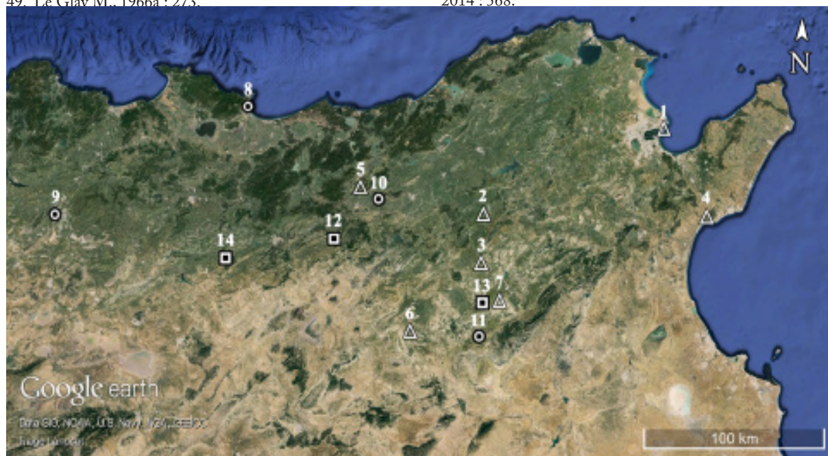
FIG. 1 : Tophets et sanctuaires de Saturne. Le sanctuaire se superpose au tophet (triangle) : 1, Carthage ; 2, Dougga ; 3, Hr el-Hami ; 4, Thinissut ; 5, Thuburnica ; 6, Althiburos (?) ; 7, Hr Ghayadha (?). Le sanctuaire est installé à proximité du tophet (cercle) : 8, Annaba ; 9, Constantine ; 10, Chimtou (?) ; 11, Maktar (?). Le sanctuaire est relativement éloigné du tophet (carré) : 12, Ksiba ; 13, Ksar Toul Zammeul (?) ; 14, Thubursicu Numidarum (?). Carte élaborée par B. D'Andrea (Google Earth © Image Landsat).