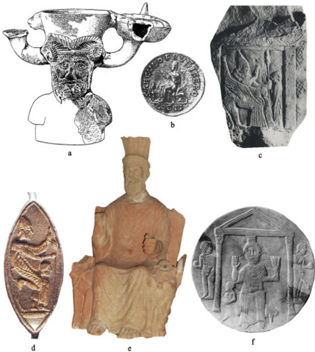
FIG. 3 : Le type iconographique traditionnellement associé à Baal Hammon : a , brûle-parfum (terre cuite, h. 0,16 m), tophet d'El Kénissia, I er siècle av. - I er siècle apr. J.-C. (Carton L., 1906 : 134-135, pl. V, 11) ; b , monnaie (or), Sousse, fin du II e siècle apr. J.-C. (Merlin A., 1910 : pl. V) ; c , stèle votive (calcaire, h. 0,17 m), tophet de Sousse, V e /IV e siècle av. J.-C. (Picard C., 1954 : Cb 1075, pl. CXXVI) ; d , bague (or, h. 0,19 m), nécropole d'Utique, IV e /III e siècle av. J.-C. (Peters S., 2004 : 235, no 13.) ; e , statuette (terre cuite, h. 0,40 m), tophet de Thinissut, II e /I er siècle av. J.-C. ; f , coupe décorée (céramique, larg. 0,30 m), ergastulum/fabrica de Chimtou, II e /I er siècle apr. J.-C. (Rakob F., 1994 : 36, tav. 123, a). Figure élaborée par B. D'Andrea, les images ne sont pas à l'échelle.

Saturne et, en effet, ses acolytes, Sol et Luna , sont représentés. Toutefois l'on observe encore des éléments typiques de Baal Hammon : la main droite levée, la main gauche qui tient un épi de blé, la couronne turrée ornée de plumes sur la tête et, surtout, le trône soutenu par deux sphinx ailés.