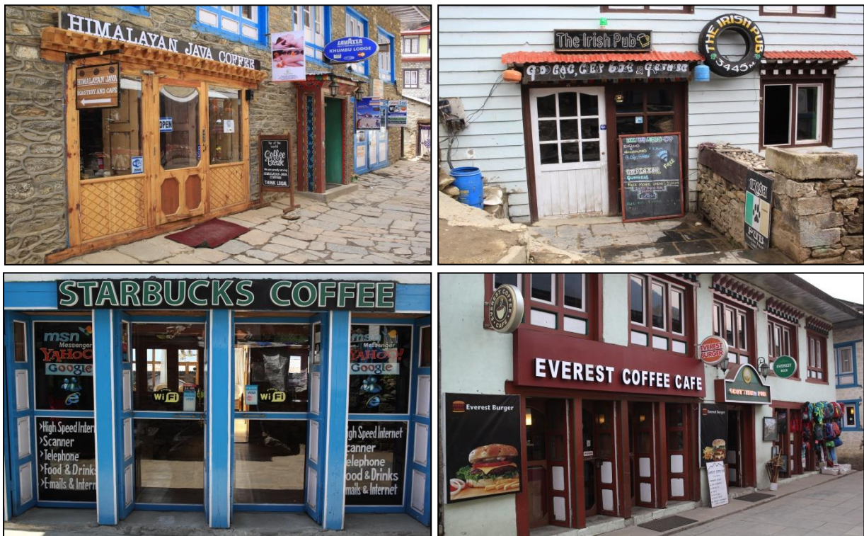
Clichés : JACQUEMET E. 2016

Le procédé le plus classique consiste toutefois à s'approprier certains emblèmes internationaux, puis à les détourner, généralement de façon humoristique et décalée, en y incorporant des symboles de la culture sherpa. Le « take away » devient ainsi le « trek away ». Le Mc Donald's devient le « Yak Donald's », avec son « Everest Burger ». L'entrée du pub irlandais se retrouve dotée de moulins à prière. Le logo de la sirène du « Starbucks Coffee » est remplacé par l'Ama Dablan, l'un des sommets emblématiques de la région.