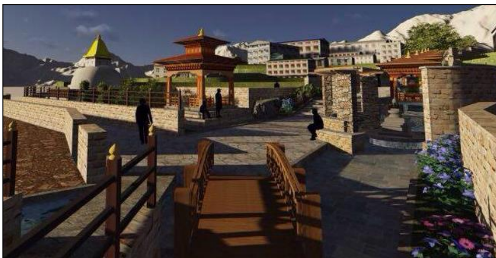
Création d'un espace public à Namche Bazaar : le « Namche Park Project »

En effet, les entretiens réalisés à Namche Bazaar et Lukla, mettent en évidence qu'une grande majorité d'entrepreneurs soutient financièrement des projets collectifs et se fédèrent au sein de clubs ayant pour objectif le développement touristique et l'animation de la vie locale. Leur implication peut se traduire par l'organisation du marché local, l'aide au financement des frais de pensionnat scolaire pour les familles les plus pauvres ou l'aide au relogement après les séismes d'avril et mai 2015. Certains projets sont beaucoup plus ambitieux et s'appuient sur des ressources importantes : des autofinancements de plusieurs centaines de milliers de dollars. Ces sommes, permettent aux associations locales de faire appel à des artistes ou des consultants de dimension nationale voire internationale. A Lukla, juste à côté du village et de l'altiport, « l'Himalaya Club », s'est ainsi lancé dans l'aménagement d'un espace comprenant en outre : un site d'escalade, un centre de méditation ou encore un parc d'observation du panda roux.