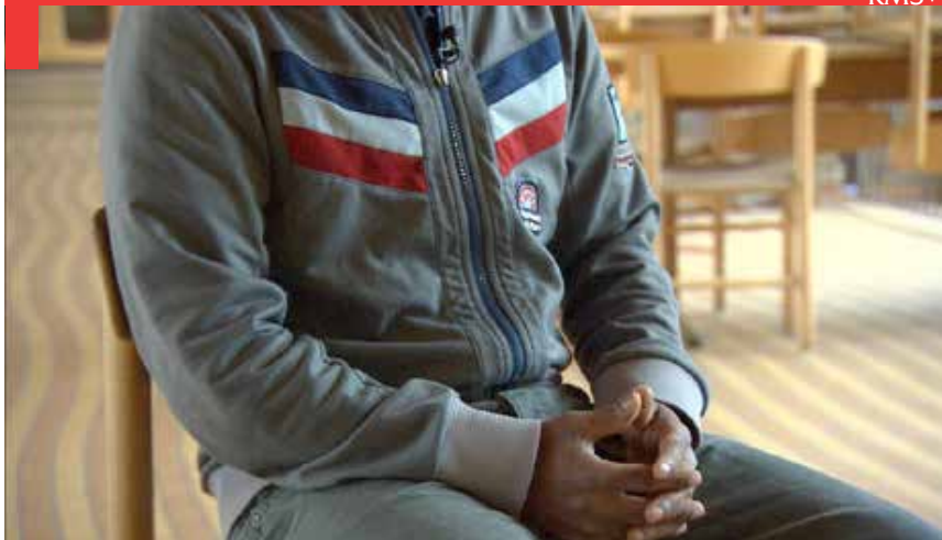
Un travail social à Aarhus, Danemark. L'approche choisie par la ville est de réintégrer, pas de condamner.