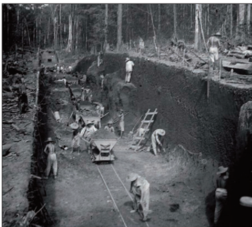
Construction de la ligne de chemin de fer

Mais si la relégation ne s'applique plus en Guyane, elle est toutefois maintenue sur le sol de la métropole. Du fait du Second Conflit mondial, un dernier convoi de relégués en direction de la Guyane est organisé en décembre 1938 et les relégués maintenus en France métropolitaine subissent dorénavant leur peine dans un établissement ou un quartier de prison spécialement aménagé 19 . La loi sur l'exécution de la peine de la relégation dans la métropole et sur l'élargissement conditionnel des relégués transportés du 6 juillet 1942 astreint les relégués au travail forcé et à une période d'observation de trois ans. À l'issue de cette période, s'ils sont reconnus aptes, ils peuvent bénéficier d'une libération conditionnelle qui ne peut devenir définitive qu'au bout de 20 ans. La relégation n'est officiellement abolie qu'avec la loi tendant à renforcer la garantie des droits individuels des citoyens du 17 juillet 1970. Mais dans les faits, elle est simplement remplacée par une tutelle pénale des multirécidivistes 20 . Cette tutelle n'est abolie à son tour qu'avec la loi renforçant la sécurité et protégeant la liberté des personnes du 2 février 1981.