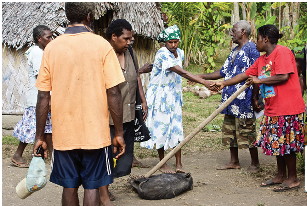
A Malekula, île du Vanuatu, les dispositifs de conciliation des disputes sont hautement formalisés. Ils incluent des discours qui exposent les raisons antagonistes et expriment les modalités de culpabilité et de résolution, échange de cochons et serrages de mains à l'appui. Par l'élicitation des attentes des uns et des autres, des malentendus et des modalités de résolution des conflits, ils mettent en scène des hiérarchies de valeur et atténuent ainsi les incertitudes provoquées par les conflits.

il était assis sur un arbre sous la forme d'un enfant-esprit attendant une mère pour y animer ce qu'il allait devenir lui-même plus tard. Loin de se limiter à la seule étude des terminologies, des règles de mariage et des principes de filiation et de descendance, comprendre la parenté, c'est interroger les principes qui, ici et là, construisent les personnes. Ces constructions, nous l'avons vu, n'ont à voir avec la procréation en tant que fait biologique que de manière subalterne.