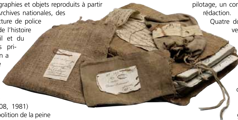
Lot de sacs de procédure judiciaire (fin XVIII e siècle, Archives nationales). Les documents proposés sur Criminocorpus sont reproduits et mis à disposition dans le cadre d'expositions montées en partenariat avec les institutions détentrices de sources (Archives nationales, archives nationales d'Outre-Mer, archives départementales, musées).

Quatre dossiers thématiques ont été ouverts depuis 2006. Ils portent respectivement sur les bagnes coloniaux , les crimes et criminels dans le cinéma de fiction , l'histoire de la police et le bertillonnage . En mai 2010, les dossiers de notre portail ont été transférés sur le portail Revues.org pour améliorer leur présentation et leur visibilité. La gestion d'articles sous le CMS