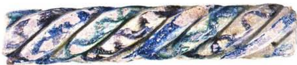
20 : Colonnette torsadée, recouverte d'engobe, et peinte en vert et brun sous glaçure, encoches au revers (long. conservée 29 cm, larg. 5,5 cm).