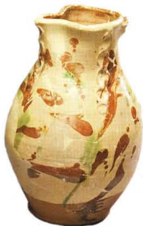
2 : Cruche de forme haute à cordon digité, panse ovoïde, anse verticale rubanée, bec pincé, fond plat à talon (ht. 32 cm). Glaçure intérieure monochrome sur engobe et marbrures d'engobe à l'extérieur : atelier de Fréjus.