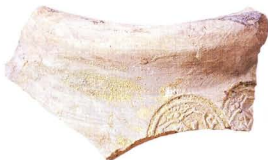
27 : Col de jarre estampillé au timbre, AVPE.