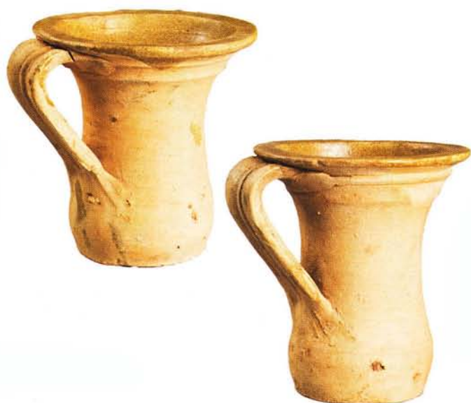
39 : Petits pots de chambre à une anse, glaçure jaune à l'intérieur (ht. 14,7 cm).