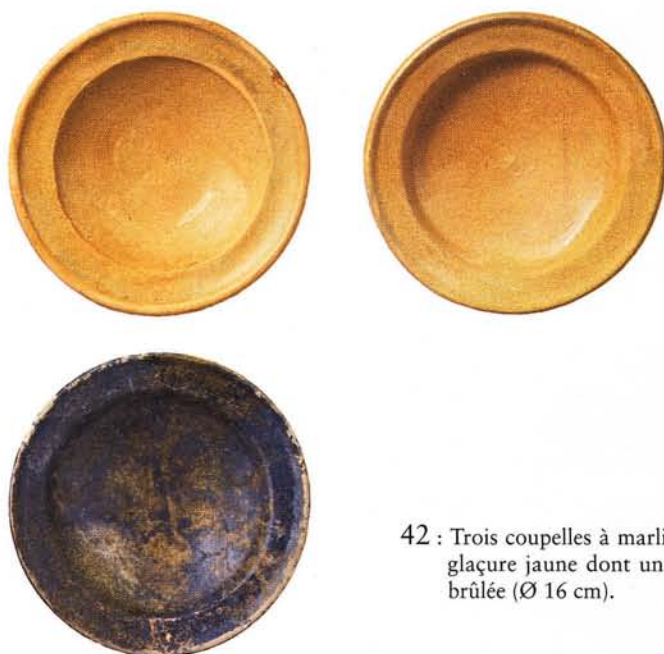
42 : Trois coupelles à marli, glaçure jaune dont une brûlée (Ø 16 cm).