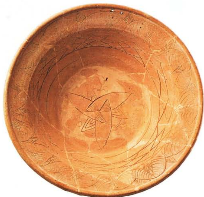
32 : Grand plat de cérémonie, à marli percé de deux trous de suspension. Décor incisé géométrique encadrant trois poissons entrelacés (Ø 42 cm).