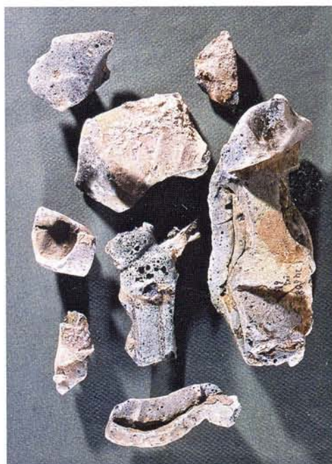
24 : « Moutons », formes de céramiques collées et fondues à la cuisson.