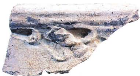
28 : Bord de cuvier à décor digité.