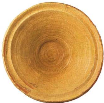
7 : Jatte à marli – Grande forme tronconique (Ø 32,5 cm), petit marli dans le prolongement de la panse, fond plat. Glaçure sur engobe : atelier de Fréjus.