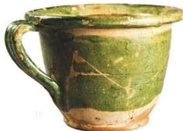
6 : Pots de chambre à panse globulaire, rebord en marli, anse verticale rubanée, fond plat à petit talon (ht. 15 et 14 cm). Glaçure intérieure jaune et extérieure verte ou brune : atelier de Fréjus.