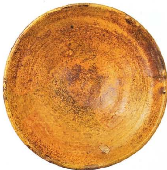
43 : Coupe creuse à carène, engobe et glaçure brun jaune moucheté (Ø 28 cm).