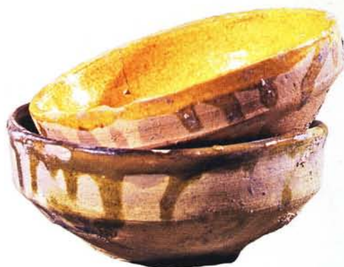
37 : Bols déformés, engobe et glaçure jaune et verdâtre (Ø 12,5 à 14 cm).