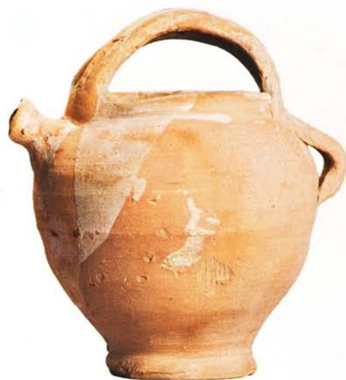
35 : Pot à anse de panier et bec tubulaire, engobe et glaçure non cuite (ht. 18 cm).