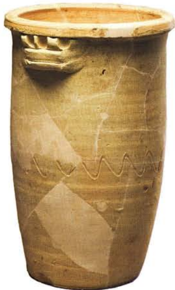
5 : Pot à conserve – Panse haute et cylindrique (ht. 32 cm), lèvre en bourrelet, deux anses horizontales digitées, fond plat : atelier de Fréjus.