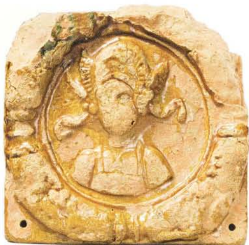
18 : Médaille d'applique recouvert de glaçure jaune, buste casqué à l'antique dans le style renaissant, quatre trous de fixation dans les angles et encoches au revers (long. 22 cm, ép. 2,5 cm).