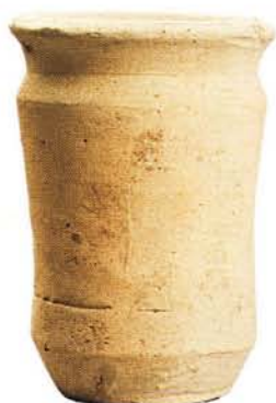
40 : Mini-albarello sans revêtement (ht. 8 cm, diam. à l'ouverture 5,7 cm).