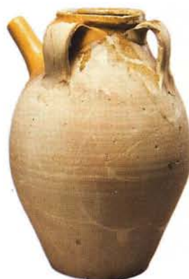
3 : Cruches de forme haute ovoïde (ht. 34 à 39 cm), col court, lèvre épaissie, bec tubulaire, trois anses verticales, fond plat. Glaçure intérieure et extérieure en bavoire autour du bec : atelier de Fréjus.