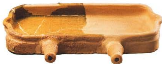
11 : Lèche-frites de forme basse, longue et rectangulaire, deux queues de préhension sur un côté et deux becs verseurs, un à chaque extrémité des petits côtés (long. conservée : 25 cm, ht. : 5 cm ; long. conservée 18 cm, ht. 5 cm). Glaçure intérieure : atelier de Biot-Vallauris.