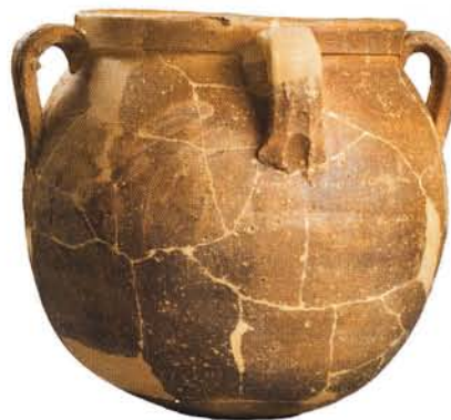
9 : Marmite de forme globulaire (Ø 27 cm), lèvre inclinée, quatre anses, fond rond. Glaçure intérieure transparente, aspect brun moucheté dû aux inclusions et à la couleur de la pâte : atelier de Biot-Vallauris.