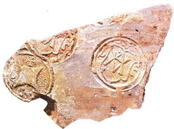
26 : Col de jarre estampillé de deux timbres, l'un aux initiales AV entrecroisées dans un blason et PF, l'autre à la rouelle, globules, croix pattée et R.