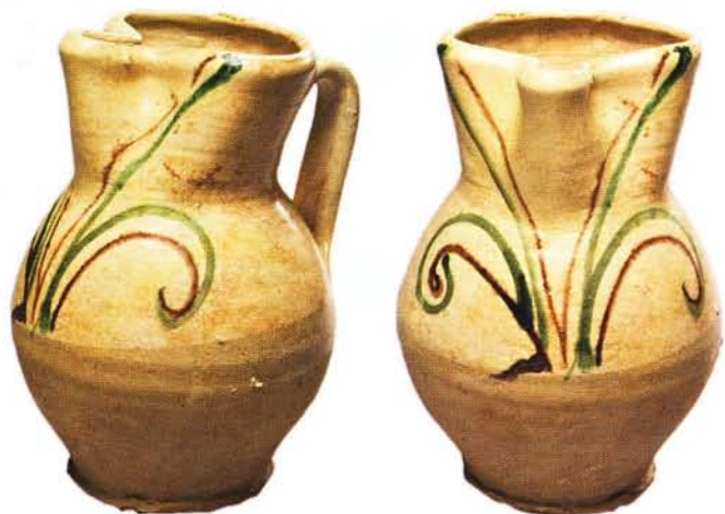
38 : Cruche à bec trilobé et décor peint en vert et brun sur engobe et sous glaçure (ht. 22,5 cm).