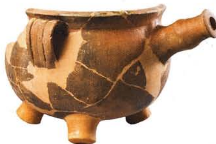
10 : Marmite à queue de forme globulaire (Ø 23 cm), lèvre inclinée, trois anses et une queue de préhension, fond rond muni de trois pieds : atelier de Biot-Vallauris.