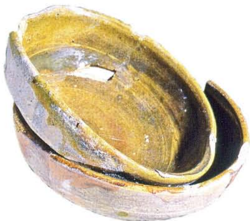
25 : Bols engobés et glaçurés, déformés à la cuisson (Ø 12 à 14 cm).