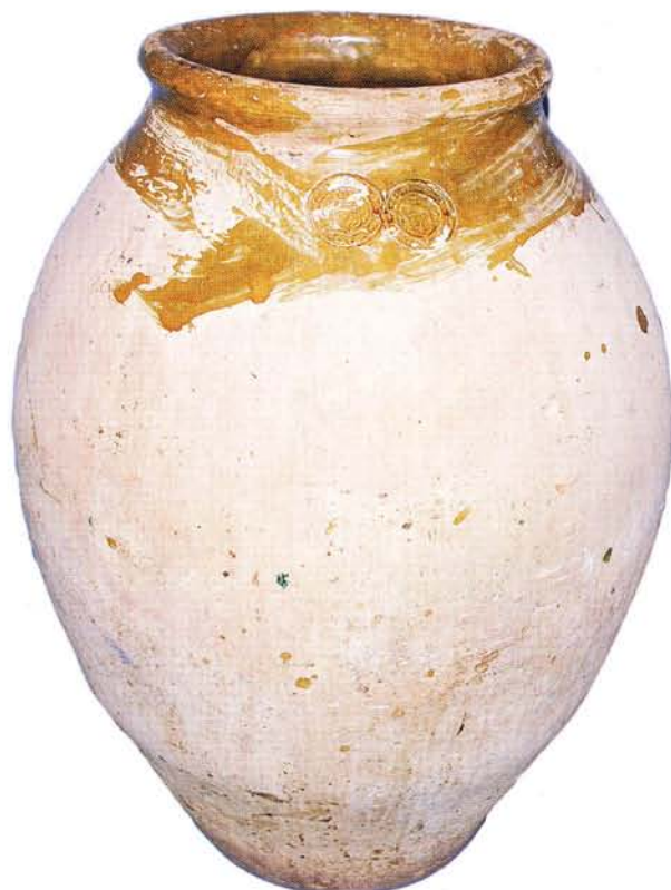
31 : Jarre, estampilles à l'écu de France et chaîne du Saint-Esprit, début XVII e s. Musée d'histoire locale de Fréjus (ht. 60 cm).