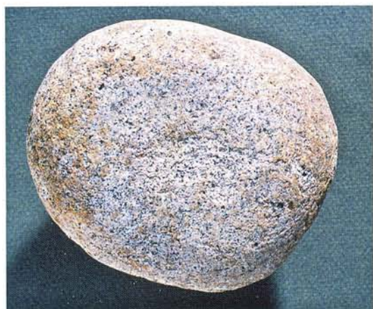
23 : Galet avec traces d'usure, utilisé comme outil (long. 12 cm).