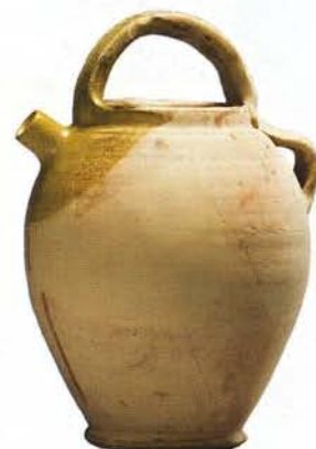
4 : Cruche de forme ovoïde (ht. 27,5 cm), lèvre arrondie, anse de panier et petite anse verticale attachée sur la lèvre à l'opposé du bec tubulaire, fond plat : atelier de Fréjus.