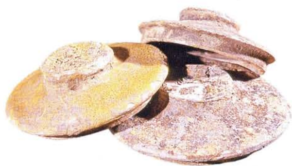
30 : Couvercles à collerette et bouton de préhension, recouverts d'engobe et de glaçure jaune mal cuite (Ø 12,5 à 15 cm).