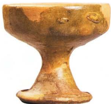
34 : Salière sur pied, engobe et glaçure jaune (ht. 7,5 cm, diam. à l'ouverture 8,2 cm).