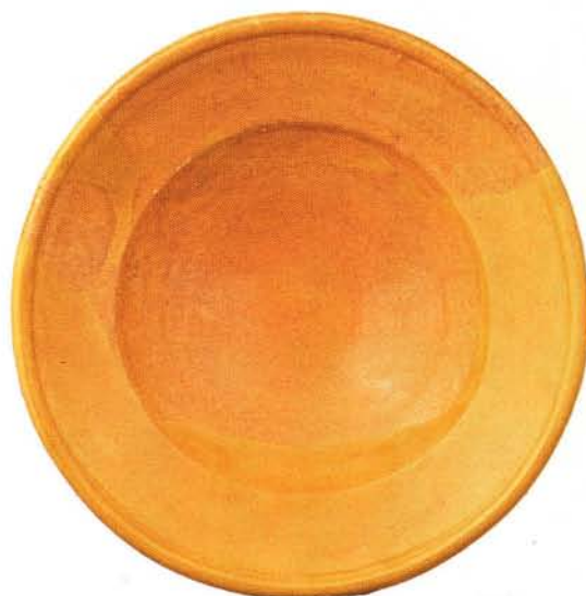
41 : Coupe creuse à marli, engobe et glaçure jaune (Ø 23,5 cm).