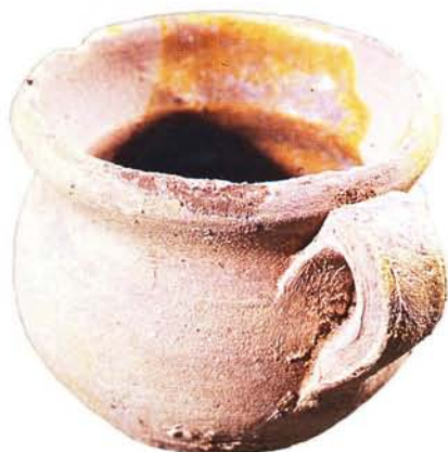
33 : Petit pot à une anse pour réchauffer les liquides, glaçure jaune à l'intérieur (diam. à l'ouverture 7 cm, ht. 6 cm).