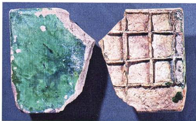
29 : Carreau de pavement engobé et glaçuré en vert, quadrillage au revers (long. 11,2 cm, ép. 2 cm).