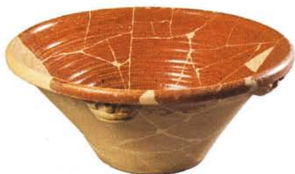
8 : Jatte à anse – Grande forme tronconique (Ø 51 cm), lèvre en bourrelet épaissi et arrondi, quatre anses digitées, fond plat. Glaçure intérieure sur engobe : atelier de Fréjus.