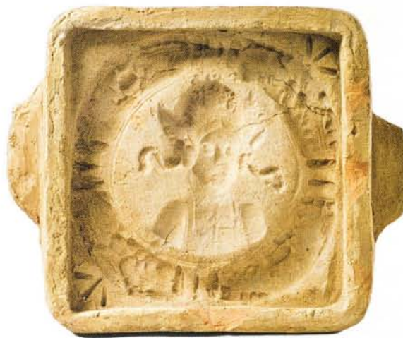
19 : Moule en terre cuite à deux préhensions correspondant au tirage du médaillon au buste (29 x 38 cm, ép. 7 cm).