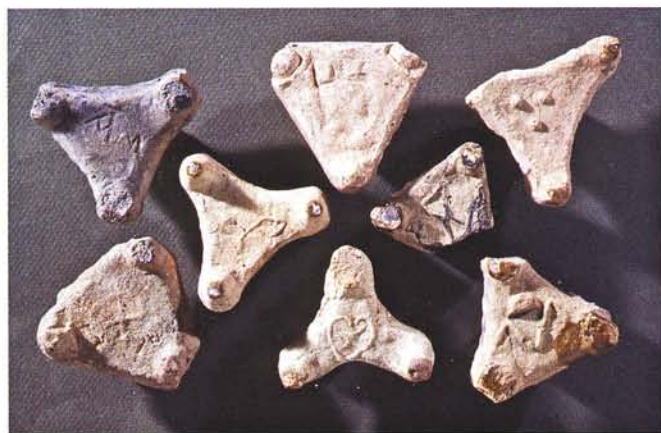
16 : Pernettes tripodes utilisées pour séparer les vaisselles dans le four. Ces artifices de cuisson, moulés, sont marqués par les artisans de signes énigmatiques, svastika, globules, écu ou plus clairement par des initiales (long. 6 cm).