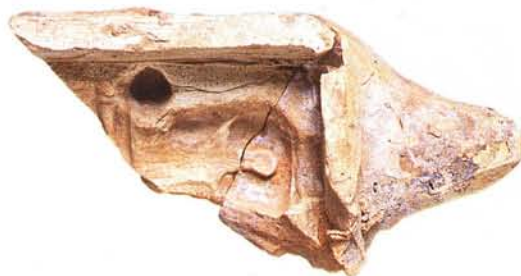
17 : Moule en terre cuite muni d'un tenon pour la confection d'une petite colonnette (long. conservée 15 cm, larg. 7,5cm).