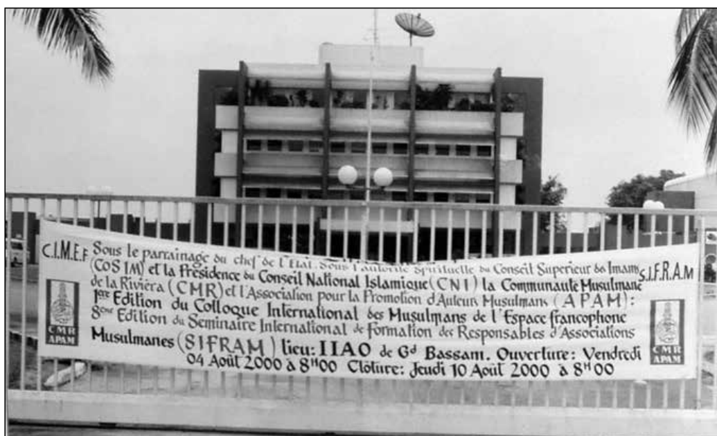
Banderole du premier CIMEF qui s'est tenu en Côte d'Ivoire en 2000