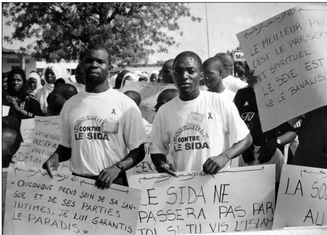
Pancartes de la première campagne islamique contre la pandémie du VIH-Sida, 1998

que locale. Au moment de la création de la fédération du Conseil national islamique (CNI) en 1993 – structure importante s'il en fut alors - le choix du président fut même assorti d'une clause précisant qu'il devait être francophone. Même les leaders du mouvement dit wahhabite/salafiste/sunnite, arabophones réputés, mirent désormais un point d'honneur à recourir au français.