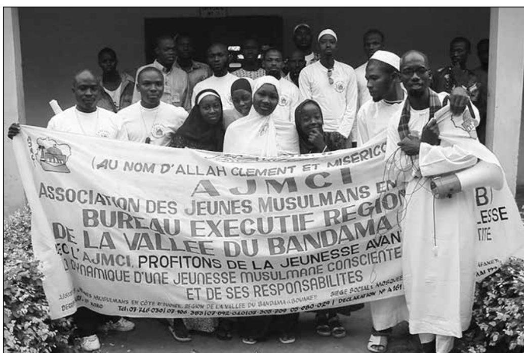
Banderole d'une section régionale de l'AJMCI, 2007

révélation. Ainsi furent-ils aussi initiés modestement à la pratique d'une certaine modernité, contrastant fortement avec leurs habitus traditionnels. Par la suite, cette expérience se trouvant reprise par d'autres régions, l'AJMCI décida d'élargir sa base au plan national pour devenir une association plus inclusive. Initialement centrée sur la jeunesse comme son sigle l'indique, l'AJMCI se donna pour nouvelle ambition de devenir « une association qui prend en compte le militant du berceau à la tombe ». À l'appui des acquis de l'association, l'objectif consiste à propager son savoir-être et son savoir-faire à travers toute la Côte d'Ivoire.