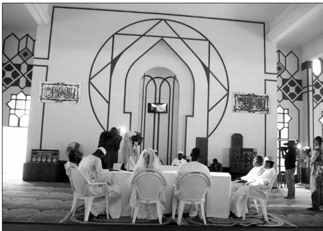
Mariage musulman à la mosquée de la Riviera Golf, 2007

Les futurs époux sont en général de jeunes couples monogames 18 issus de familles aisées. La femme est présente en robe de mariée à l'occidentale sous un tulle blanc. L'homme et la femme écoutent l'imam et d'autres officiants leur parler – en français – de leurs obligations réciproques puis ils attestent à tour de rôle de leur libre engagement dans le mariage. Leurs témoins certifient leur bonne moralité et, ensemble, ils apposent des signatures sur des documents. Famille et amis assistent à la cérémonie sur des chaises disposées comme des bancs d'église, femmes d'un côté, hommes de l'autre. Photographes et cameramen immortalisent l'événement.