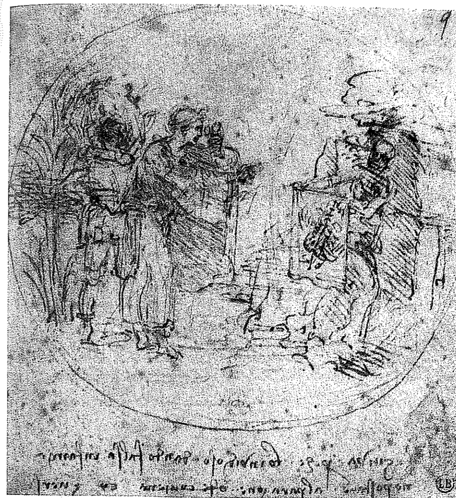
2. Bayonne, Musée Bonnat, inv. 656 recto, Leonardo da Vinci, 1494 ca., Allegoria del "Moro cogli'occhiali", sanguigna ripassata a penna e inchiostro su carta bianca.

to che, in luogo dell'altro simbolo che le è consono (la bilancia 14 ), nell'altra mano regge uno specchio, emblema della veritiera conoscenza di se stessi 15 e, come tale, da sempre associato alla virtù della Prudenza per alludere all'attitudine introspettiva che la caratterizza. Costituisce, dunque, una figurazione della Prudenza (della quale è una connotazione inconfondibile, del resto, la conformazione bifronte della testa, a significare la capacità di raccogliere in sé la conoscenza sia del passato che del presente) la seconda immagine femminile, vera protagonista della rappresentazione, mentre la Giustizia, infatti, è confinata in un ruolo di passiva assistenza, la Prudenza appare drammaticamente coinvolta, in audace torsione, nella rocambolesca dinamica dell'assalto, al punto che, essendo il braccio sinistro impegnato a circondare protettivamente il "gallaccio", la sola