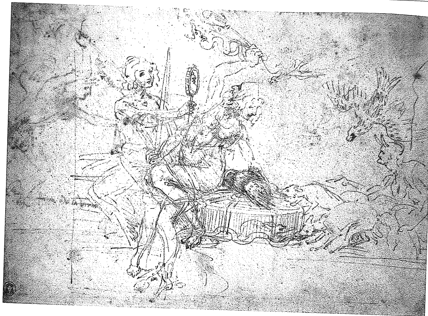
1. Oxford, Christ Church Collection, inv. JBS 18 (0037) recto, Leonardo da Vinci, 1485-1488 ca., Allegoria del governo del ducato milanese, penna e inchiostro bruno su carta bianca ingiallita.

ma ancora non ufficializzato indusse Ludovico a tessere un'accorta dissimulazione della propria ingerenza negli affari di stato, fino a quando, nel 1493 (e in leggero anticipo sulla morte del nipote, 1494), ottenne l'investitura formale a duca di Milano da parte dell'imperatore Massimiliano d'Asburgo, col quale aveva instaurato un forte sodalizio politico e personale, sancito anche dalle nozze tra un'altra sua nipote (Bianca Maria, sorella di Gian Galeazzo) e lo stesso Rex Romanorum 6 .