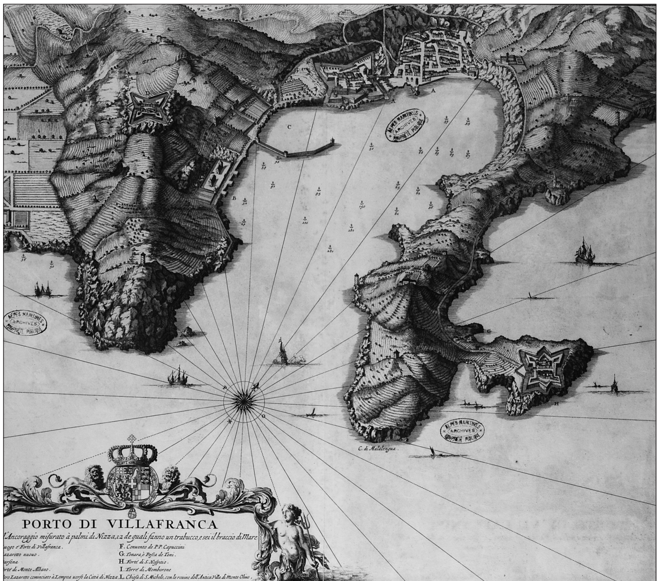
Fig. 1 : Porto di Villafranca , archives des Alpes-Maritimes (réf : 01FI-0046) XVIII e siècle.

Le gisement du Palais de la Marine se situe à la lisière d'un herbier de posidonie et d'un tombant vaseux qui commence à 11 mètres de profondeur. Le mobilier