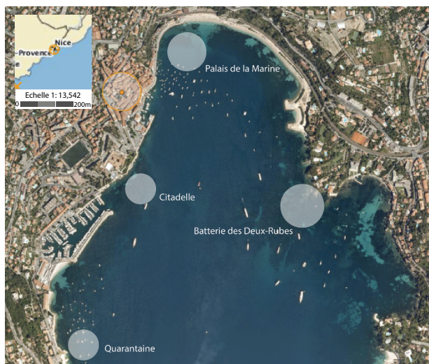
Fig. 2 : Localisation des secteurs prospectés dans la partie nord de la rade.

daté majoritairement entre le XVII e et le XVIII e siècle est présent dans une couche sablo-vaseuse de 10 à 30 centimètres d'épaisseur. La formation de ce dépotoir est en lien avec une zone de mouillage naturellement présente face à la ville et fréquentée par les caboteurs, les commerçants ou encore les pêcheurs. Le gisement de la Citadelle, au pied du fort Saint-Elme, commence au départ d'un plateau sableux à 12 mètres de profondeur. Le mobilier est daté principalement du XVI e et du XVII e siècle. Contrairement à celle du dépotoir du Palais de la Marine, sa formation est en lien avec une zone de mouillage qui, protégée par les canons du fort, est surtout fréquentée par les galères ducales et celles des alliés du Duché de Savoie (Dieulefet, Dulière 2015, 53).