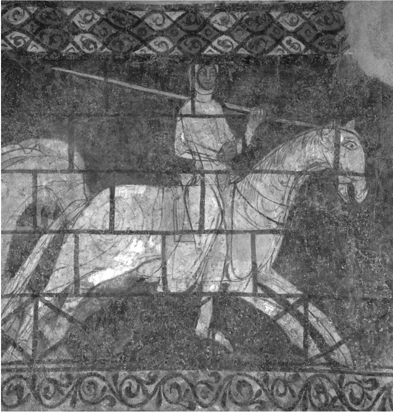
FIG. 4 – Le cavalier blanc.