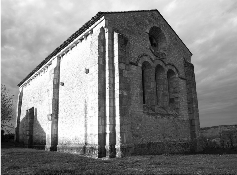
FIG. 1 – La chapelle de Cressac.