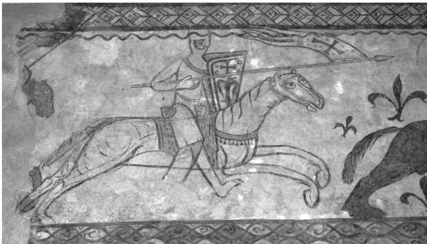
FIG. 2 – Le chevalier croisé du registre supérieur des peintures de la paroi nord.