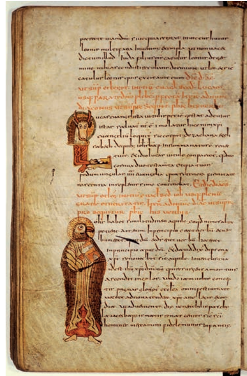
Fig. 3. Lettre L avec tête de saint Luc et homme avec tête de saint Jean. Bibliothèque nationale de France, ms. Latin 12048, ff. 42v

croise, s'inscrit dans une tradition iconographique bien connue au IX e et X e siècles dans certains manuscrits bretons et insulaires où l'on a développé l'iconographie sacerdotale du Christ et des évangélistes 13 . Au sujet de ce que l'on pourrait appeler la "sacerdotalisation" de la représentation du symbole de Mathieu dans l'initiale du sacramentaire de Gellone, Marianne Beyssère a fort justement interprété ce choix iconographique en lien avec la volonté de représenter à la fois l'évangéliste et son symbole, ainsi que l'image du célébrant qui, au moment du rituel de l'explication des évangiles, est amené à actualiser la parole contenue dans le texte du rituel. Dans ce sens, on pourrait suggérer que l'initiale du symbole de Matthieu dans le sacramentaire de Gellone incarne ce qu'elle est censée être et pas seulement représenter –le symbole de l'évangéliste– et en même temps, elle incarne la personne du prêtre qui active la parole du rituel destinée à pénétrer l'esprit des futurs baptisés par les oreilles ouvertes à la parole et au message qui leur est transmis dans le déroulement du rituel. Au moment de l'exécution du rituel de l'apertio aurium , l'initiale de Matthieu du sacramentaire de Gellone incarne "réellement" et à la fois la figure de l'évangéliste, l'explication transmise aux oreilles des catéchumènes et la