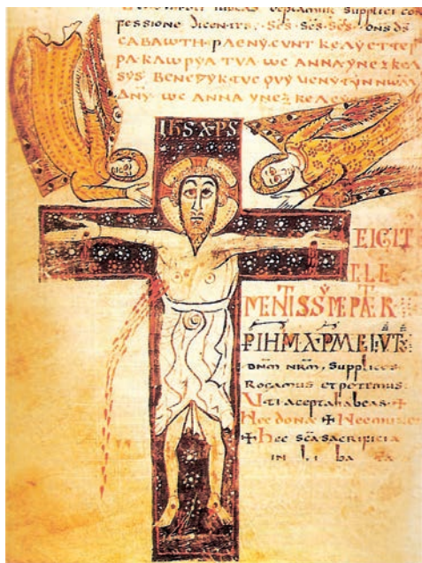
Fig. 1. Crucifixion. Bibliothèque nationale de France, ms. Latin 12048, ff. 143v