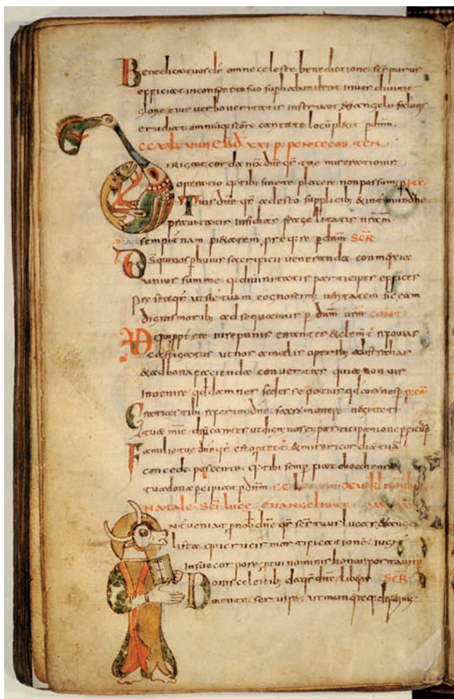
Fig. 4. Homme à tête de boeuf saint Luc. Bibliothèque nationale de France, ms. Latin 2048, ff. 115v

symbole de saint Jean, l'aigle, conjugée au corps d'un homme. L'évangéliste est debout, formant le "I" initial du nom " Iohannes " transcrit à côté de l'image. Le personnage et sa tête d'aigle sont nimbés et son corps semble comme enveloppé dans les ailes de l'aigle, voilant à peine les vêtements sacerdotaux du personnage, même si l'étoile n'est pas ici représentée. Dans sa main gauche, l'évangéliste zoocéphale tient un livre fermé et, de sa main droite, il désigne le texte transcrit juste à côté et contenant l'explication du symbole incarné dans l'initiale historiée. Le geste effectué par le symbole de saint Jean avec la main droite n'est pas sans rappeler celui attribué à l'évangéliste Luc peint au folio 115v, comme si, dans les deux cas, le peintre avait voulu faire figurer le prêtre célébrant sous les traits des évangélistes et désignant de la main les paroles qu'il s'apprête à prononcer et à rendre réellement présentes dans le rituel par la vue et l'ouïe. Dans l'explication du symbole de Jean donnée dans le rituel de l'ouverture des