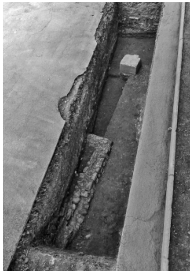
Fig. 7 – RIEZ, collège Maxime Javelly. Angle sud-est du bâtiment et du socle reconnu dans la tranchée [Tr.5] (cliché SDA04).

Au sud du chenal, deux tranchées ont livré des maçonneries appartenant au quartier d'habitation méridional. Il s'agit, d'une part, d'un angle de bâtiment très arasé, auquel est associé le support carré d'une pile ou d'un pilier (fig. 7) et, d'autre part, d'une canalisation orientée