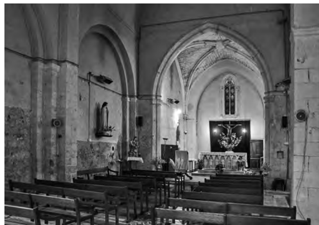
Fig. 8 – SAINT-MICHEL-L'OBSERVATOIRE, église Saint-Pierre. Vue de la nef et du chœur depuis le sud-ouest.

De ce premier édifice qui devait être à nef unique et voûté en berceau, subsiste également la partie haute du parement du gouttereau sud, observable depuis l'extérieur de l'église actuelle, ainsi qu'une partie des piles cruciformes du même mur, tardivement percé par une série de chapelles latérales. Un dallage de calcaire, mis au jour à l'angle nord-est entre la nef et le chœur, pourrait aussi appartenir à ce premier état.