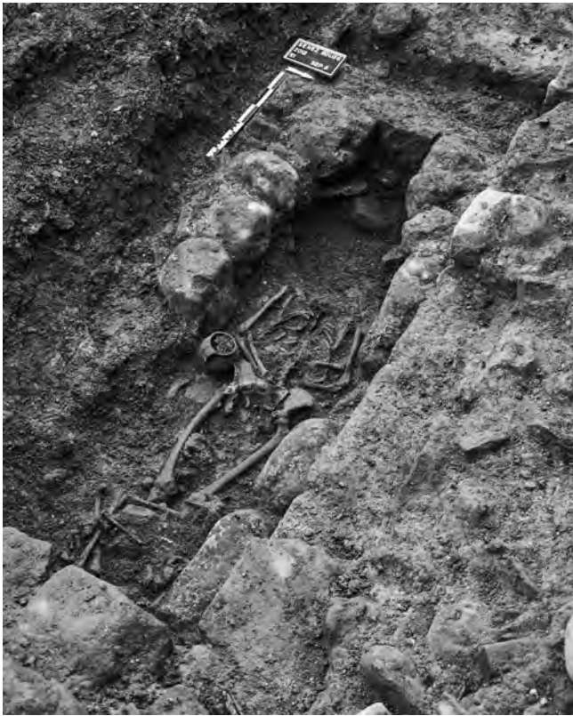
Fig. 12– SENEZ, place de l'église. Vue de la sépulture US 5 depuis le nord-est (cliché SDA04).

De manière générale, la stratification – principalement formée de remblais mêlés à des dépôts alluvionnaires – est extrêmement importante sur l'ensemble de la zone diagnostiquée, parfois supérieure à 1 m sous les niveaux contemporains, soit plus de 2,50 m sous le niveau de sol actuel. Ni le substrat géologique ni les niveaux stériles n'ont été atteints lors du diagnostic.