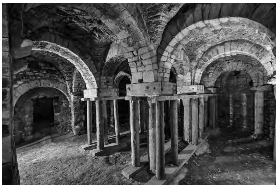
Fig. 17 – ENTREPIERRES, prieuré de Vilhosc. Vue de la partie orientale de la crypte depuis le sud-ouest.

Les chapiteaux et les colonnettes d'albâtre de Saint-Geniez semblent bien provenir d'un approvisionnement local, dans des gisements situés à proximité du site. Leur disposition dans l'édifice pourrait toutefois suggérer qu'il s'agit d'éléments remployés, même si leur facture est romane.