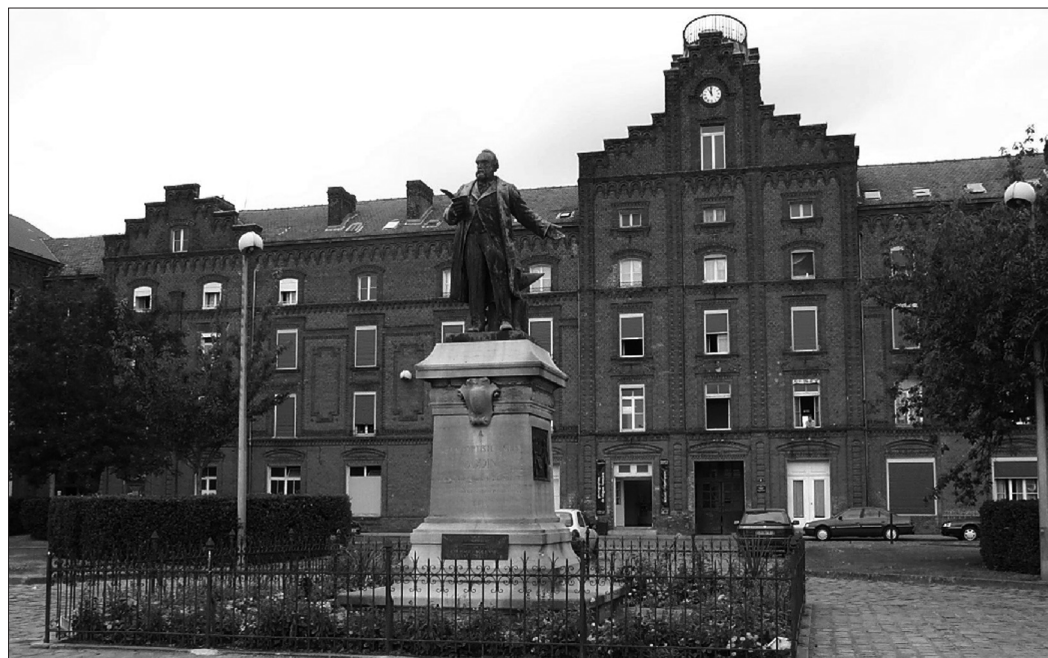
Photo 4 : Le pavillon central du Familistère Godin à Guise (cl. C. Hochedez, juillet 2003) Centerbuilding of the Godin Familistère in Guise

This cow, made out of old metal barrels will stay at the entrance of the village nine months after the "festivache" event is closed.