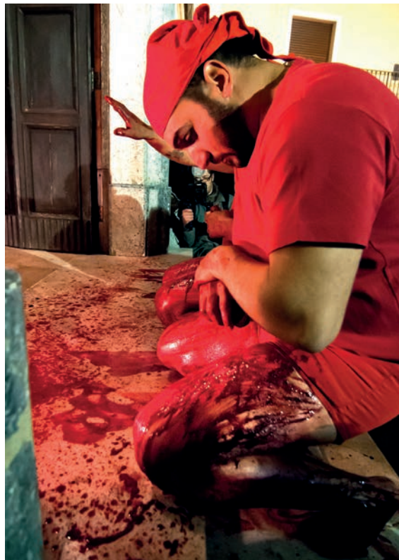
2. Battenti se flagellant sur le seuil de l'église.

Le premier examine des cérémonies, se déroulant plusieurs fois par an à Naples, qui impliquent la manipulation d'ampoules contenant du sang coagulé, dont la provenance est attribuée à la décapitation de Saint Janvier – sa tête serait quant à elle conservée dans un buste reliquaire. Lors du rapprochement rituel des ampoules avec ce buste, qui « re-présentifie l'événement fondateur » (p. 71), les participants espèrent que le sang retrouve son état liquide, ce qui est un signe de bienveillance de la part du saint. Selon l'historien Niola, cité par l'auteur : « Le sang, symbole de mort quand il est coagulé dans le reliquaire, change de signe au moment de la liquéfaction, devenant symbole de vie » (p. 71). En approfondissant l'analyse, D'Onofrio montre qu'il existe un lien entre la périodicité du miracle et le sang menstruel, faisant de Saint