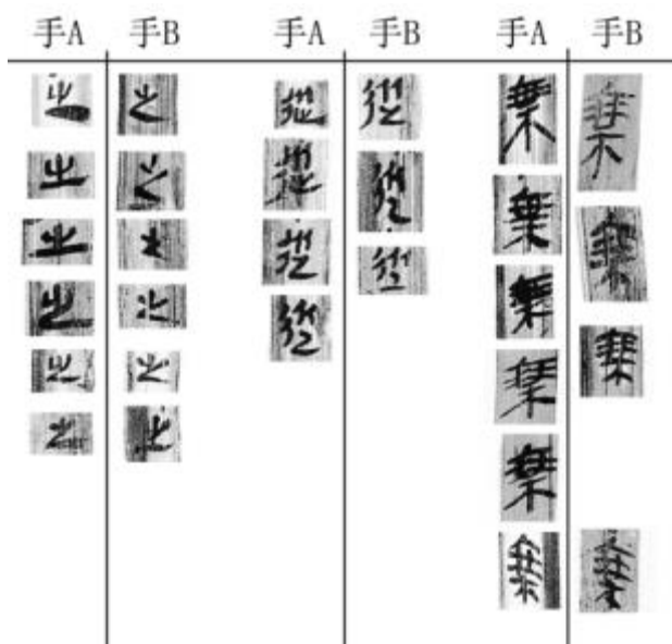
圖 2: 正文常用字比較