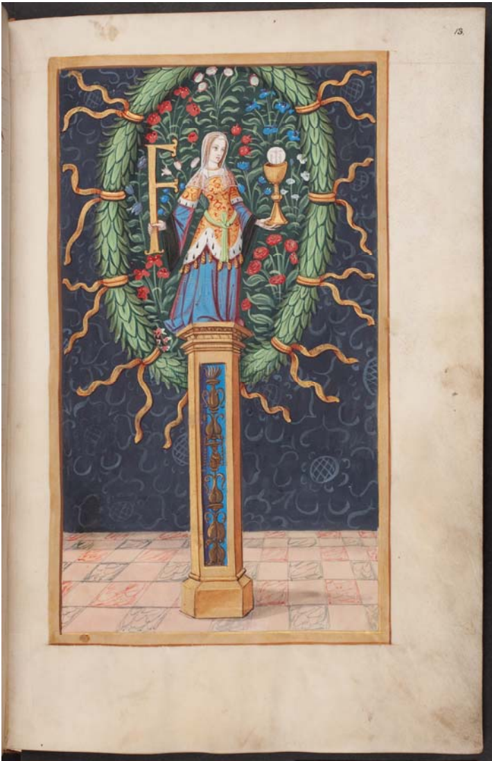
Fig. 1 : La Foi, Herzog August Bibliothek, Wolfenbüttel, Cod. Ex. 86.4, f°13.

Avant même d'entrer dans les limites de la cité, François put assister à une première histoire : sur la Saône, un navire tiré par un cerf blanc ailé transportant divers personnages (fig.2).