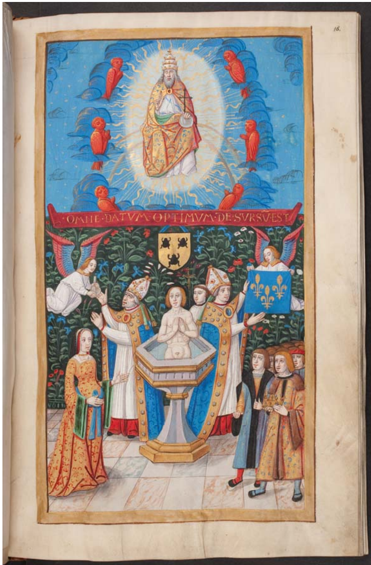
Fig. 4 : Le baptême de Clovis, Herzog August Bibliothek, Wolfenbüttel, Cod. Ex. 86.4, f°18r.