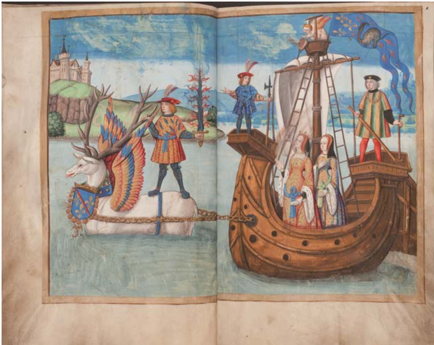
Fig. 2 : Le cerf volant tirant la nef de France, Herzog August Bibliothek, Wolfenbüttel, Cod. Ex. 86.4, f°7v-8r.

Cette première histoire comportait de nombreuses références au connétable de Bourbon, représenté sur le dos du cerf, par ses armes, mais également sur un autre échafaud. Il était arrivé à Lyon deux semaines avant le roi et avait déjà eu sa propre entrée 26 . Liant ainsi la symbolique du connétable, allié du roi, à celle de la lignée des rois de France depuis Clovis, réactivée par Charles V 27 , les conducteurs de l'entrée créaient une image riche en significations emboîtées. L'élément chrétien est ici subtilement mis en scène par la présence du cerf ailé 28 .