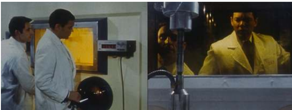
Extraits du feuilleton Les Atomistes