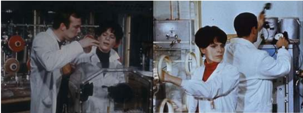
Extraits du feuilleton Les Atomistes