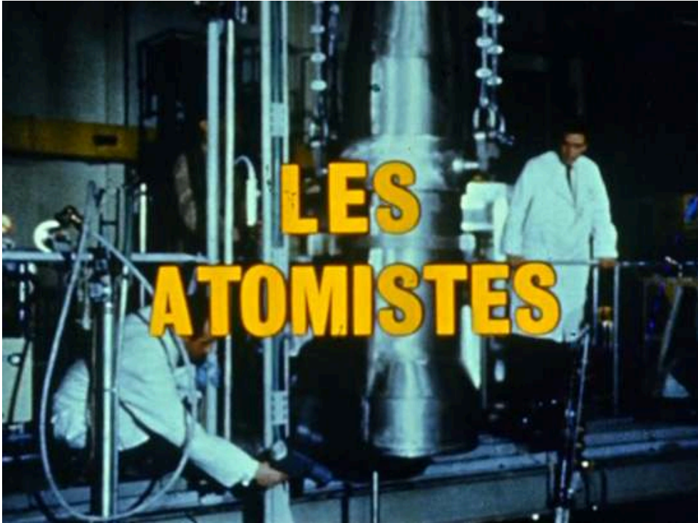
Photogramme 1. Générique des Atomistes (Léonard Keigel, 1968)