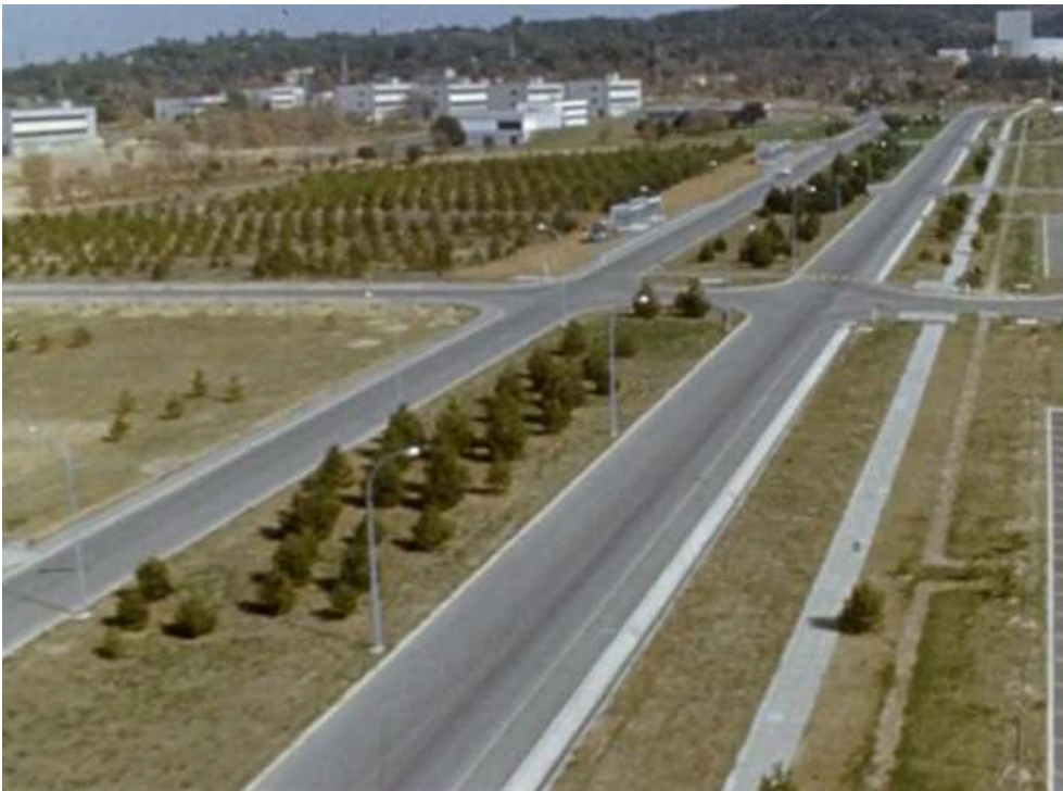
Extrait du feuilleton Les Atomistes