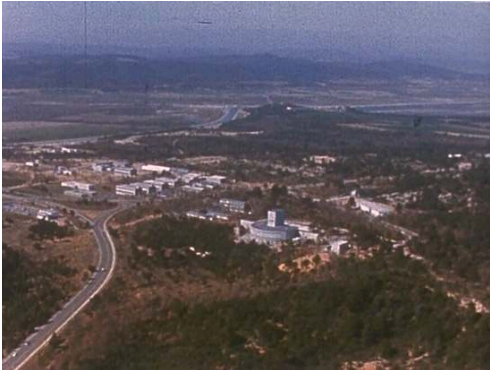
Extrait du feuilleton Les Atomistes