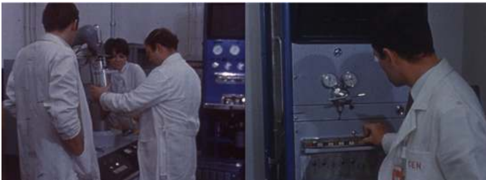
Extraits du feuilleton Les Atomistes