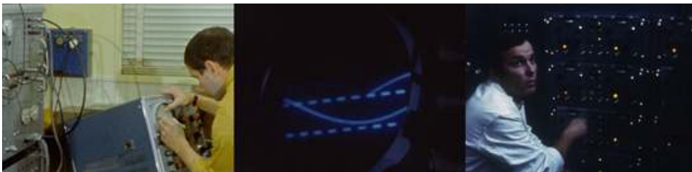
Extraits du feuilleton Les Atomistes