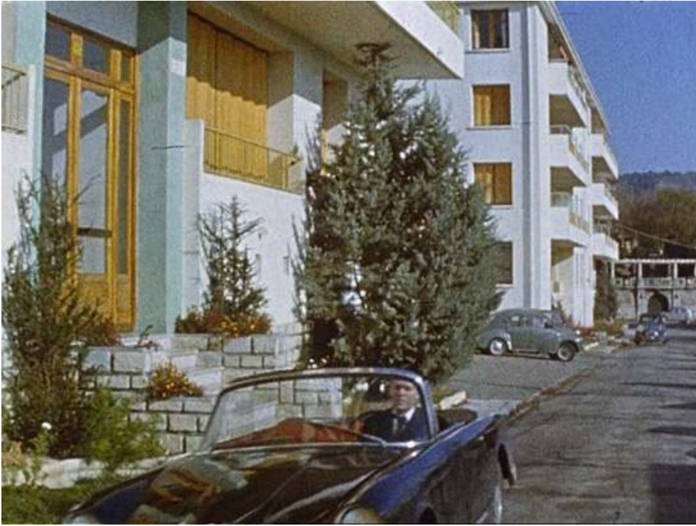
Extraits du feuilleton Les Atomistes