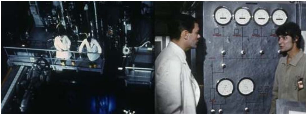
Extraits du feuilleton Les Atomistes