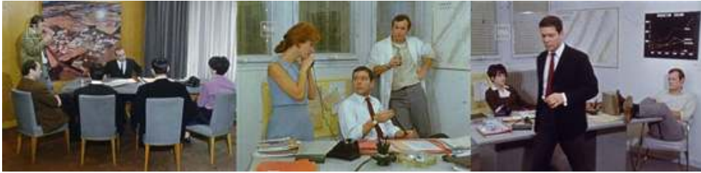
Extraits du feuilleton Les Atomistes