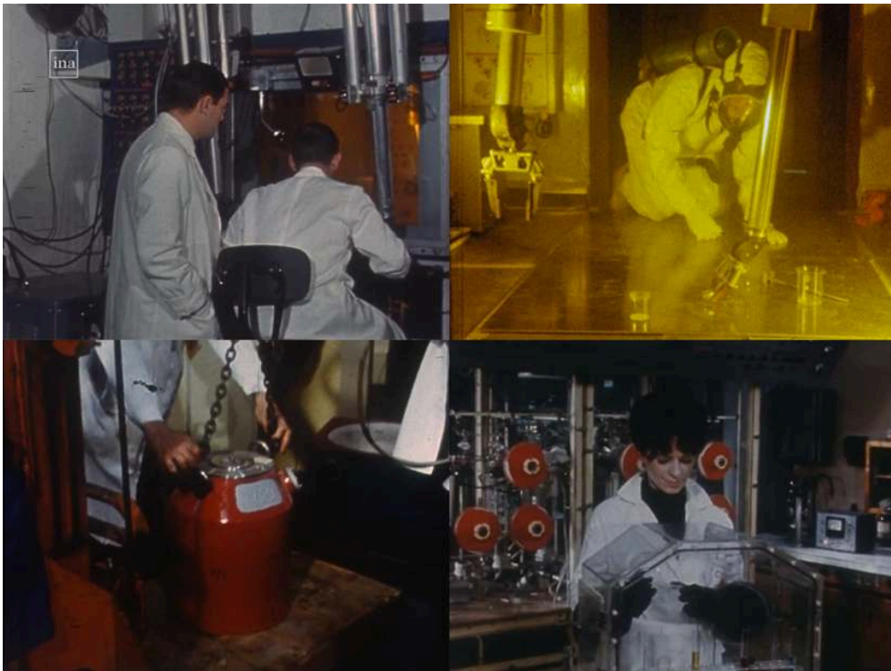
Extraits du feuilleton Les Atomistes