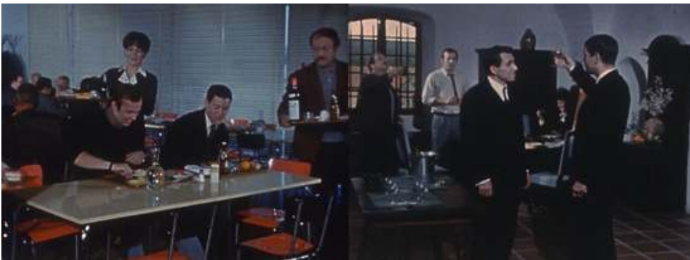
Extraits du feuilleton Les Atomistes