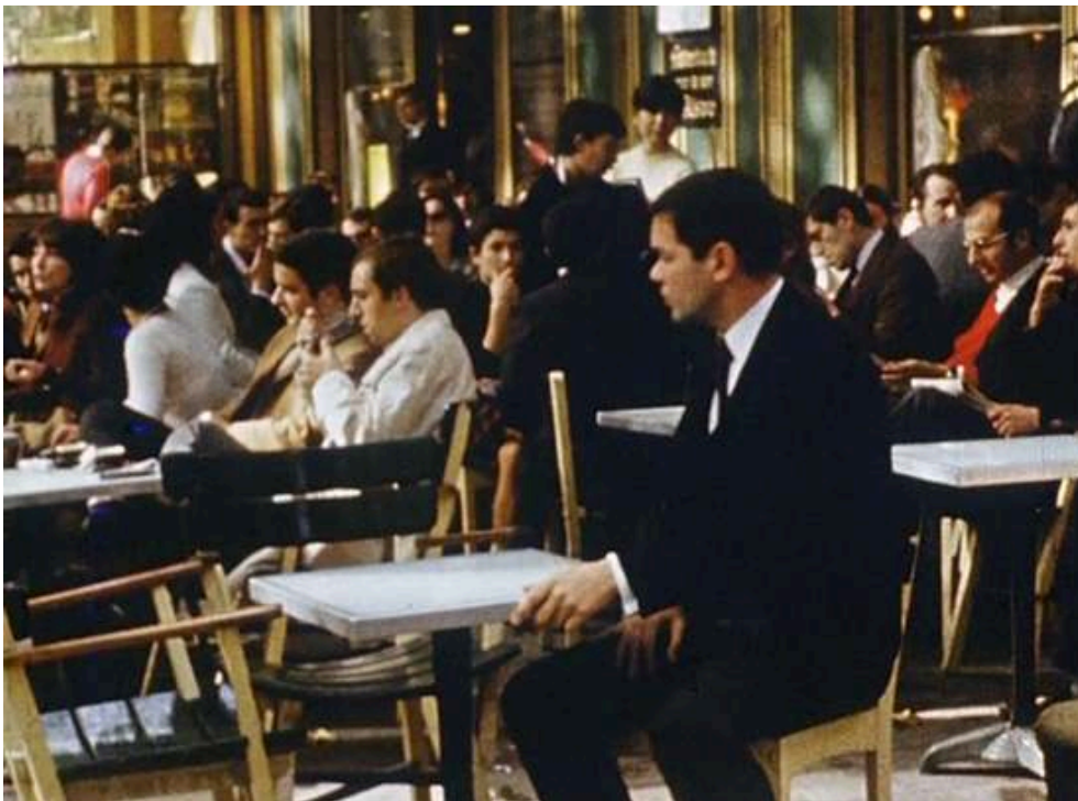
Extraits du feuilleton Les Atomistes