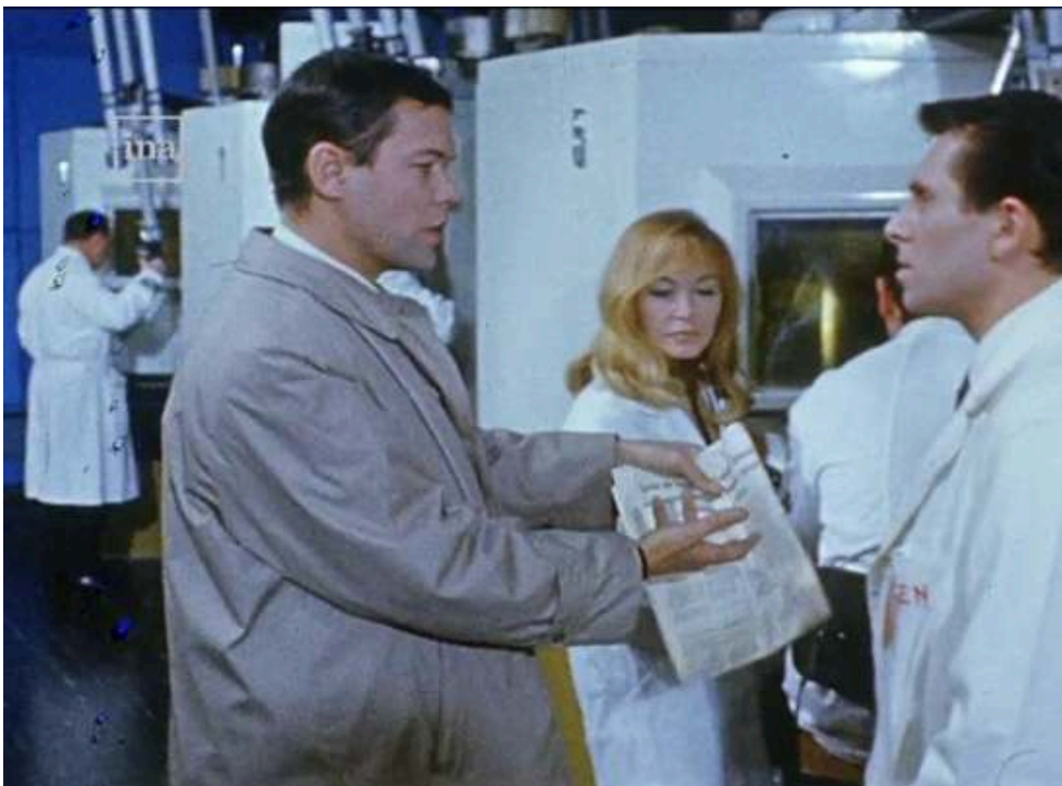
Extraits du feuilleton Les Atomistes