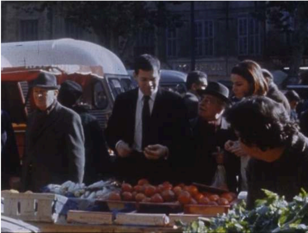
Extraits du feuilleton Les Atomistes