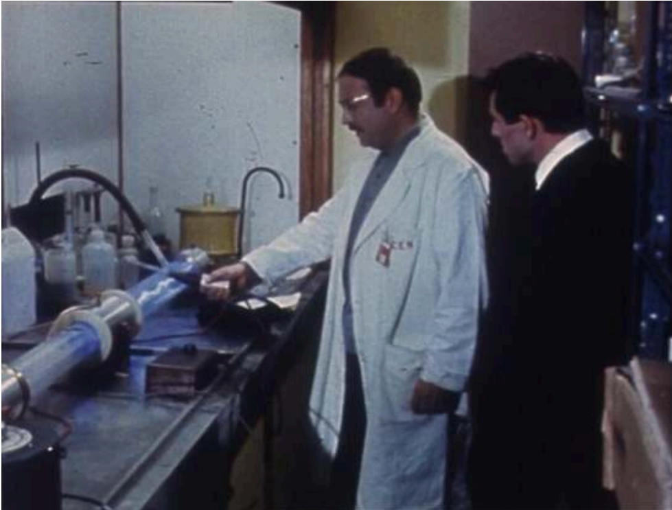
Extraits du feuilleton Les Atomistes