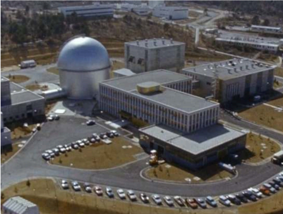
Extrait du feuilleton Les Atomistes