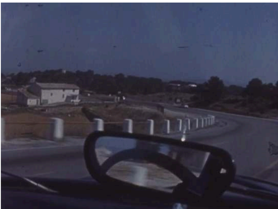
Extraits du feuilleton Les Atomistes