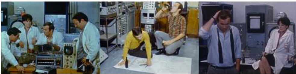
Extraits du feuilleton Les Atomistes