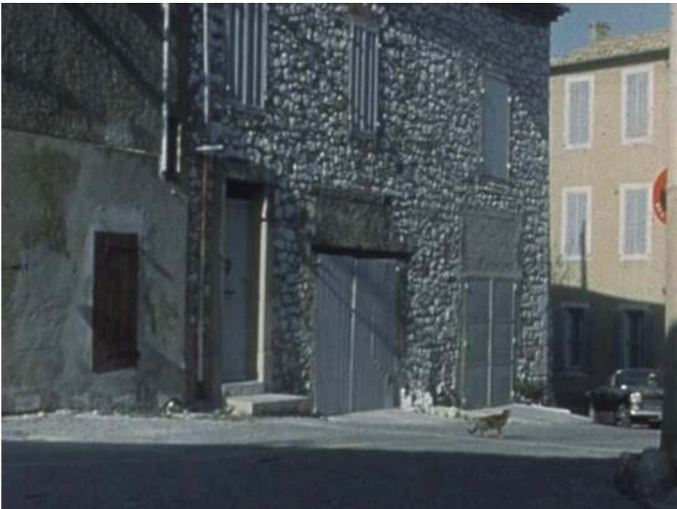
Extraits du feuilleton Les Atomistes