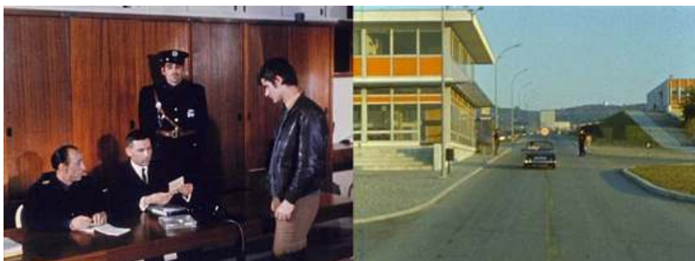
Extraits du feuilleton Les Atomistes