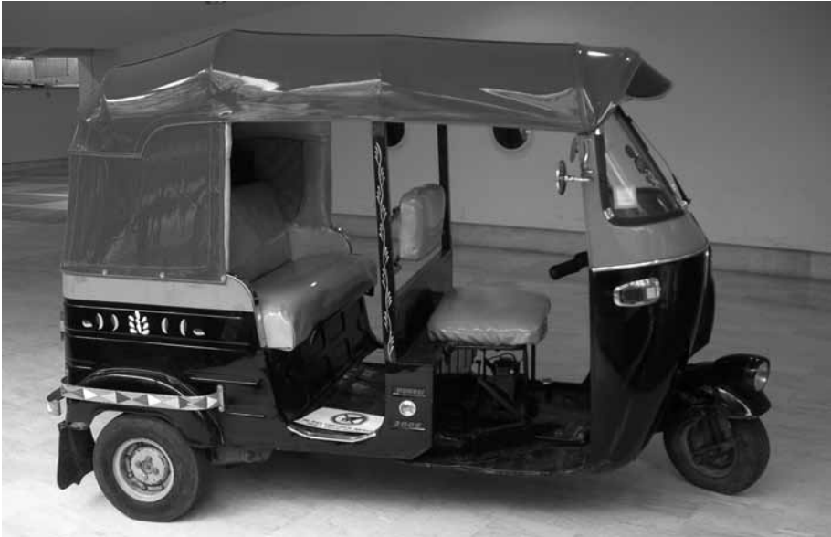
Fig. 1 - Autorickshaw Bajaj RE 25. Moteur à deux temps de 145,45 cm 3 , refroidissement à air. Châssis monocoque en tôle d'acier emboutie (2625 x 1300 x 1710 mm), 277 kg à vide. « Lucky » est un modèle fabriqué en 1983, moteur et châssis d'origine. Rénovation complète (cl. F. Wateau).

Récupérés, ils constituent souvent un stock de pièces à recycler. Conservés, ils deviennent parfois la mascotte à trois roues de propriétaires qui exploitent aujourd'hui un parc renouvelé. Revendus, ils appartiennent à de jeunes passionnés qui viennent de loin pour les rénover 1 (fig. 1).