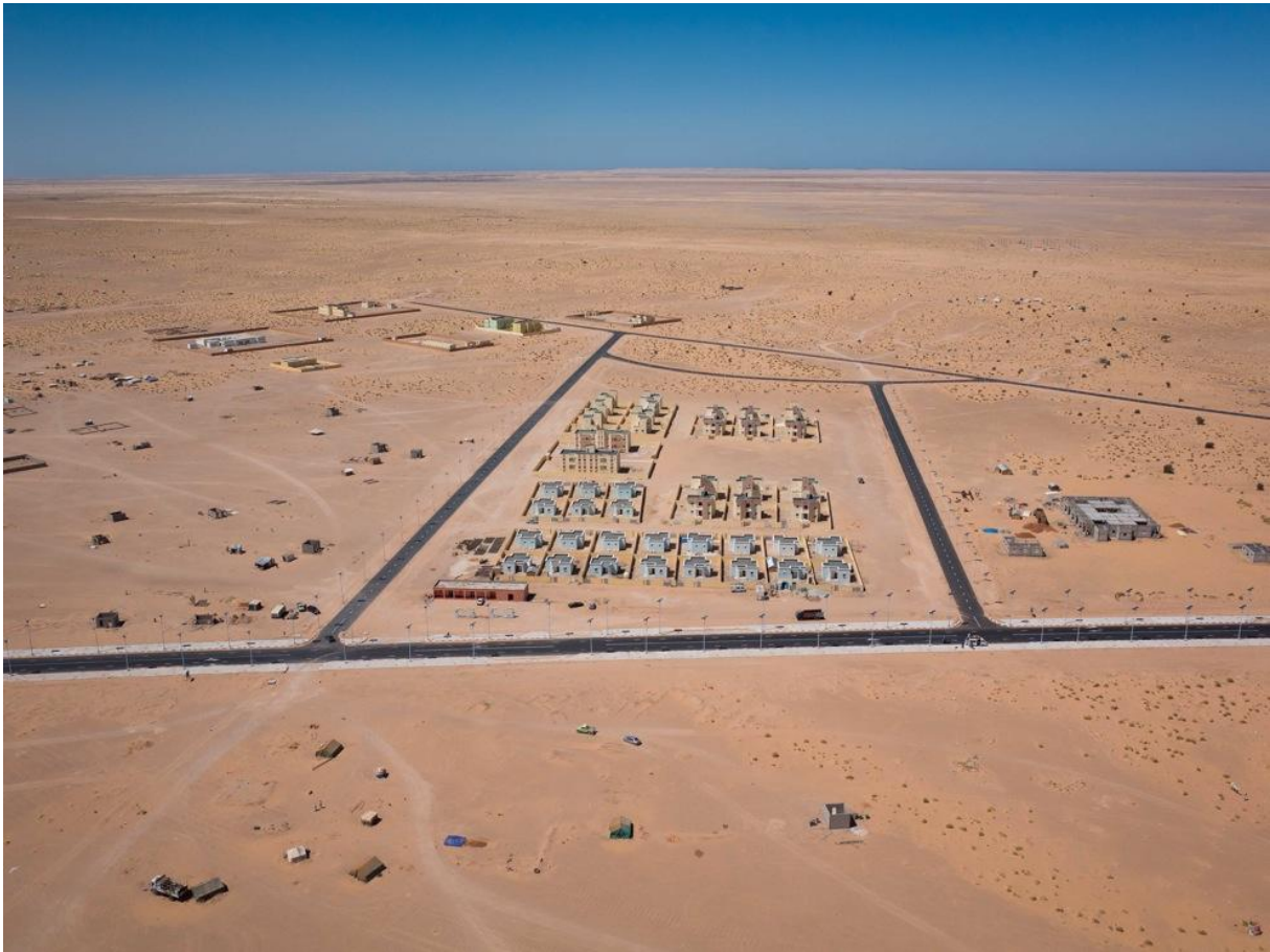
Vue aérienne de Chami, 2014