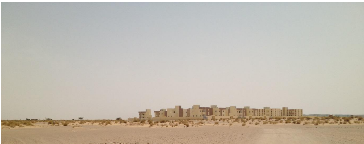
Vue des logements de la société ISKAN. Photo Taleb, 2014

Les résultats du travail de terrain montrent l'attachement des habitants de Chami à un idéal de leur ville où les services de base sont disponibles et gratuits ou bon marché, les litiges fonciers sont absents et une administration proche de ses sujets et intégrant ces derniers dans l'approche de la maîtrise du territoire et en premier lieu l'accès à la propriété foncière. En fait, on ne peut pas dire que toutes ces attentes sont en cours de réalisation à Chami mais au moins une grande partie est d'ores et déjà assurée dans cette ville émergente.