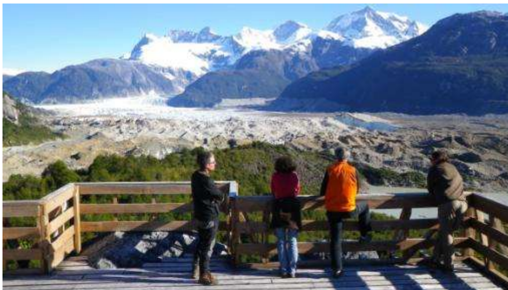
Photo 9 : Glacier dans la vallée des explorateurs, région d'Aysén, 2011

Avec mes remerciements à Patricio Segura et Nelson Huenchunir pour les illustrations du « Manual de Carreño de la Patagonia », 2014, disponible sur ISSUU : http://issuu.com/psegura/docs/manual_de_carre_o_de_la_patagonia_ays_n