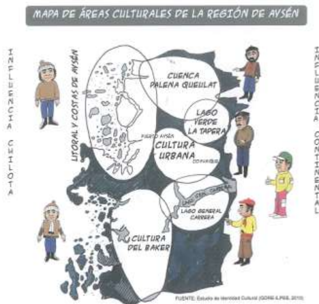
Photo 7 : Les 5 zones culturelles de la région d'Aysén avec une forte opposition entre l'influence chilote du littoral d'un côté et l'influence continentale, gauche et urbaine, de l'autre, dans le « Manual de Carreño de la Patagonia » de Segura et Huenchunir (2014)

Entre les deux visions, celle de Pablo Neruda, chantre de la beauté « tellurique » du monde et la nostalgie d'un Blaise Cendrars, le destin de la Patagonie semble ambivalent. La Patagonie reste une terre d'extrême, celle de la possibilité d'une liberté quasi absolue dans le projet et l'action individuelle, mais « tristement », aussi, un espace où la construction d'une société plus juste se fait attendre et où les valeurs de l'opportunisme, de l'argent facile et de la loi du plus malin, dominant.