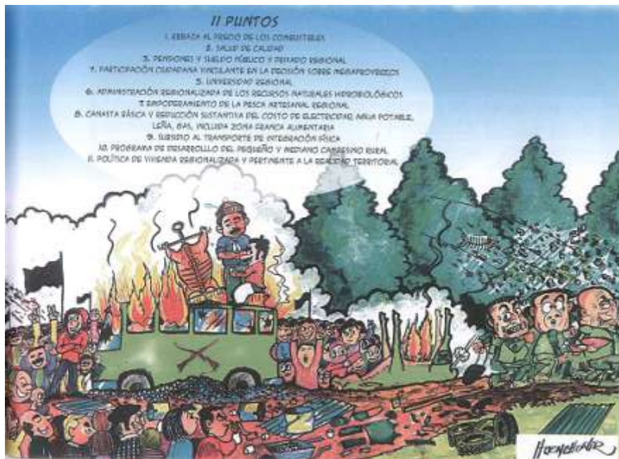
Photo 5 : Illustration du mouvement social d'Aysén de 2012, dans le « Manual de Carreño de la Patagonia » de Segura et Huenchuañir (2014)

C'est bien cette question de la construction d'un « monde meilleur » qui est à l'ordre du jour au niveau planétaire. La course en avant vers plus de « modernité » semble bien être la source de la crise écologique majeure que nous vivons. Mais de quel monde meilleur parlons-nous ?