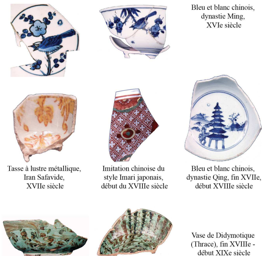
Bleu et blanc chinois, dynastie Ming, XVIe siècle