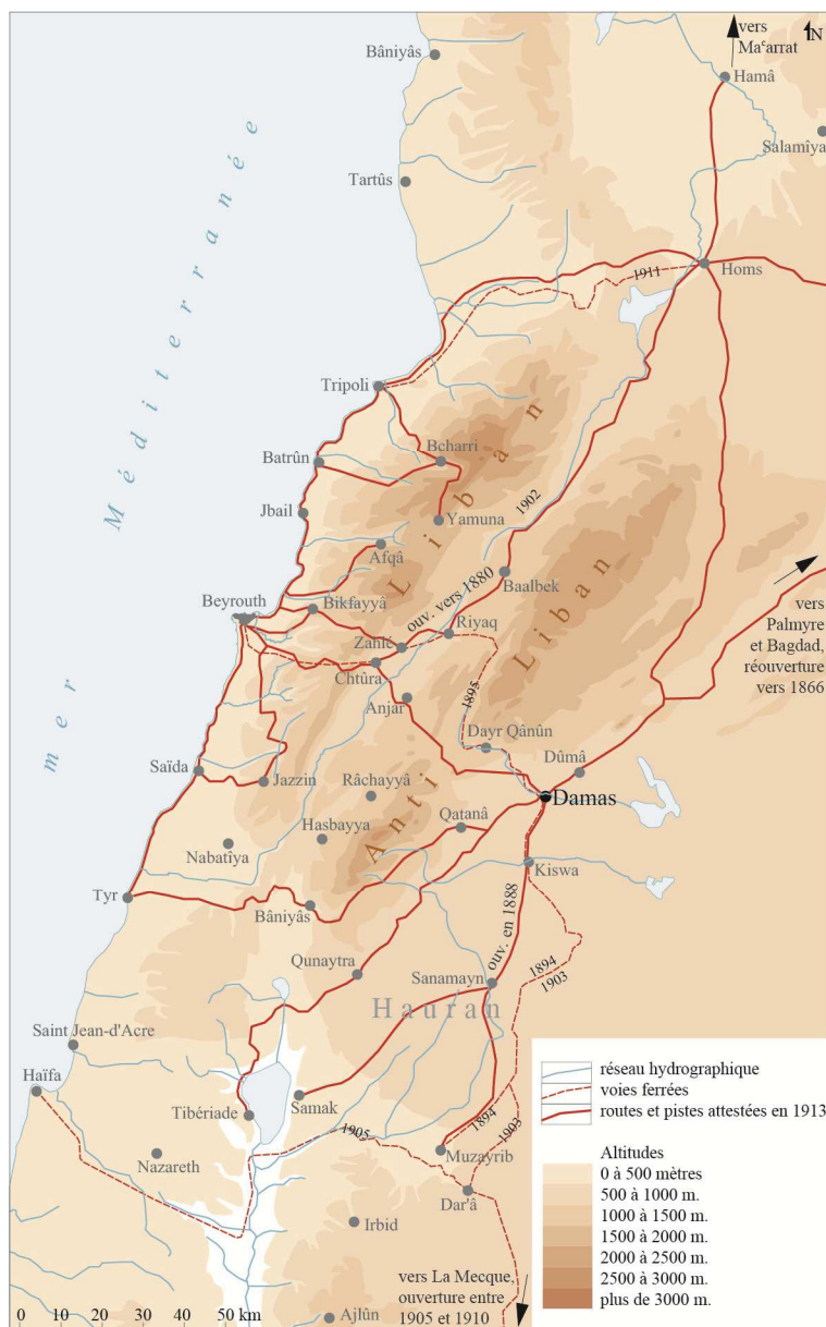
Figure 4. Voies de communication des environs de Damas en 1913. A la veille de la Première Guerre mondiale, on compte plus de 3 000 km de routes carrossables dans la région de Damas, cette carte témoigne de l'ampleur des travaux réalisés au cours du demi-siècle précédent. Dessin de l'auteur d'après Notice sur la Syrie , 1916, Paris, Hachette.

Baniyas (47 km) est qualifiée de mauvaise, c'est plutôt un chemin de caravanes, elle compte de nombreux gués et des sections de chemins pierreux. L'auteur montre aussi que de nombreuses routes manquent d'entretien, en particulier depuis l'ouverture des nouvelles voies ferrées.