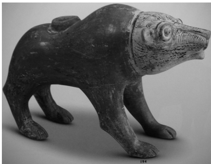
Fig. 1. Rhyton zoomorphe en forme d'ours, Kültepe, XIX e siècle av. J.-C. Musée des Civilisations Anatoliennes, Ankara (Özgüç 1998:248; 2003:200)