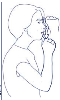
« un musée » (langue des signes française). In : La langue des signes, t2. Dictionnaire élémentaire bilingue.

Transmission de langues entre pairs dans les cours d'école ; Analyse des productions linguistiques en créole des enfants de grande section de maternelle ; Transmission du créole mères/enfants et acquisition non didactique dans les établissements scolaires de la Réunion ; Étude comparative de la transmission familiale et de l'acquisition non didactique du vietnamien dans les communautés niçoise et lyonnaise ; Transmission familiale et acquisition non didactique des langues, arabe maghrébin : dynamisation de la transmission familiale par la visibilité dans le domaine public (musique, comédie, reconnaissance dans le système scolaire) ; Transmission des langues : pratiques linguistiques dans les familles bilingues d'origine étrangère .