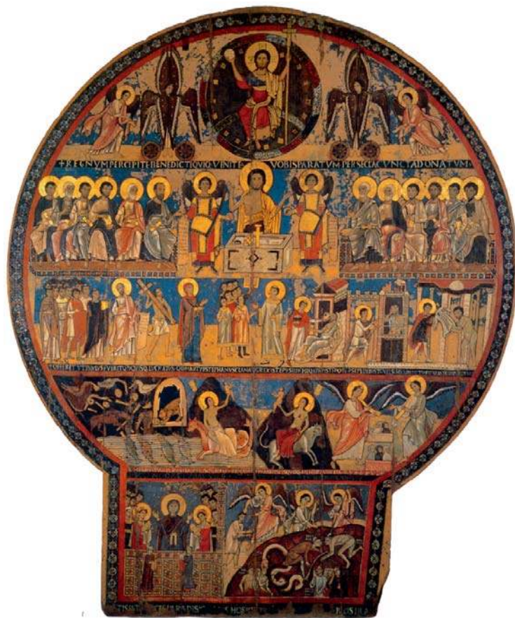
6. Jugement universel, 1061-1071, Cité du Vatican, Musei Vaticani.