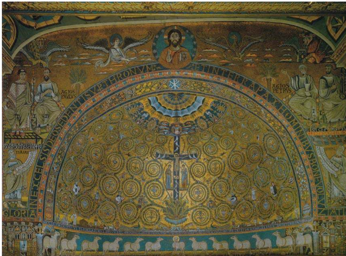
11. Mosaïque de la calotte absidale et arc de triomphe, vers 1118, Rome, San Clemente.

La mosaïque représente, sur la calotte absidale, un Christ mort sur la croix – que certains ont aussi interprété comme un reliquaire en raison de l'inscription déployée en bas de la calotte – d'où partent des sarments d'acanthé ornés d'animaux, de scènes de la vie quotidienne, de putti et d'oiseaux. L'arc de triomphe abrite la représentation de deux binômes de saints : à droite, Pierre et Clément ; à gauche, Paul et Laurent (fig. 11). Au centre, le Christ bénissant est entouré d'un clipeus surmonté des symboles des évangélistes ; sur les côtés, on aperçoit les prophètes Jérémie (à droite) et Isaïe (à gauche). De nombreuses inscriptions, qui courent le long de l'arc absidal, au pied des binômes de saints, sur les cartouches des prophètes et à la base de la calotte absidale, viennent compléter la décoration.