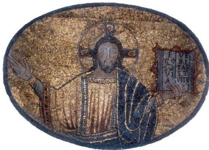
10. Le Sauveur en buste, vers 1113, Rome, San Tommaso in formis.

À la suite des travaux du Corpus , il semblerait que la première manifestation, à Rome, d'une renaissance de l'art de la mosaïque, doit être reconnue dans celle de San Bartolomeo all'Isola, que Simone Piazza date du XII e siècle, sous le pontificat de Pascal II. Il s'agit de l'image d'un Christ à mi-corps (fig. 10) appartenant à une plus vaste décoration située sur la façade de l'église, remplacée par une façade baroque en 1625. Se fondant sur les Considerazioni sulla pittura de Giulio Mancini 21 , érudit ayant vécu entre le XV e et le XVI e siècle, où la datation de la mosaïque est située sous le pontificat de Pascal II – dont le nom figure aussi sur l'inscription gravée sur l'architrave du portail d'entrée – et compte tenu du fait que Pascal II avait choisi, en 1105, d'établir sa résidence sur l'île tibérine, le chercheur a pensé qu'il fallait avancer la datation de l'œuvre en 1113, s'opposant ainsi à l'hypothèse selon laquelle elle daterait du milieu du XII e siècle, ou d'une période légèrement postérieure (MATTHIAE, GANDOLFO, 1988, p. 58, 265). L'année 1113 correspond en effet aux travaux effectués dans l'église et mentionnés sur l'inscription du portail. La mosaïque manifeste, selon Piazza, des affinités stylistiques avec les visages des martyrs de l'oratoire marial de Santa Pudenziana, avec les peintures de l'abside de Castel