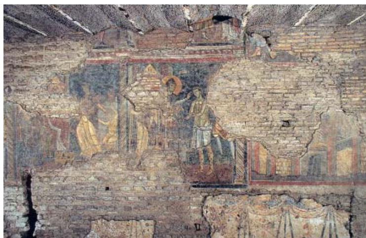
7. Histoire de saint Benoît, 1061-1071, Rome, San Crisogono, paroi septentrionale de la basilique inférieure.