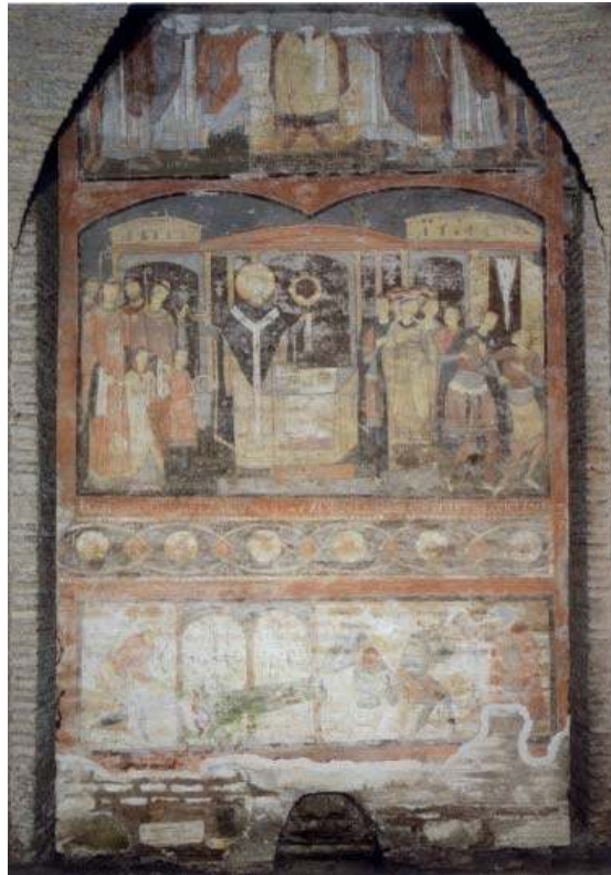
8. Messe de saint Clément , 1078-1084, Rome, San Clemente.