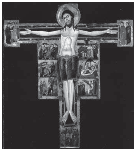
14. Crucifixion , vers 1129, Rosano, abbaye Santa Maria Assunta.

Dans ce contexte, et plus près du sujet de la peinture romaine, la publication des résultats de la restauration de la croix de Rosano (CIATTI, FROSININI, BELLUCCI, 2007 ; fig. 14) et le congrès organisé au Kunsthistorisches Institut de Florence en 2009, sur le thème La pittura su tavola del XII secolo (FROSININI, MONCIATTI, WOLF, sous presse), dont on peut lire le compte rendu publié par Tagliaferri (TAGLIAFERRI, 2009), ont permis d'ajouter une nouvelle œuvre au Corpus de la peinture romaine, et en outre de réfléchir aux liens entre l'art de Rome et le contexte « européen ». S'opposant à l'hypothèse rattachant l'auteur de la croix de Rosano au milieu toscan (BOSKOVITS, 1993, p. 206-217), Monciatti, pour ce qui concerne la culture figurative (MONCIATTI, 2007), Tommaso Gramigni et