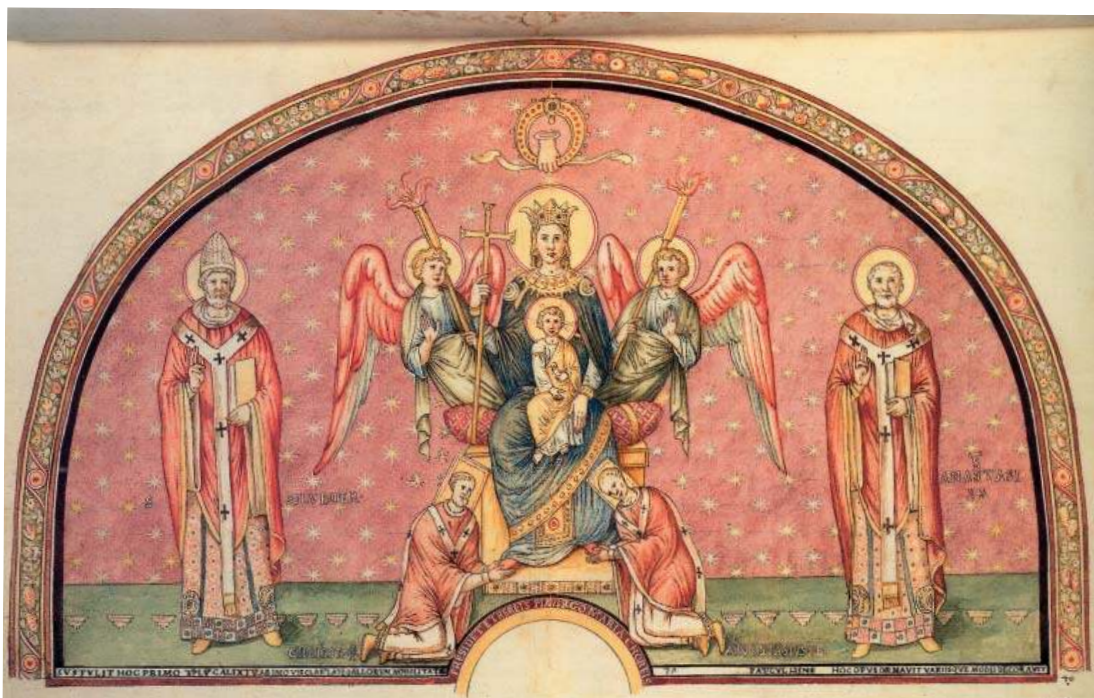
9. Vierge trônant entre saint Silvestre et saint Anastase , provenant de Rome, oratoire de San Nicola al Patriarchio Lateranense, œuvre perdue [ROMANO, 2006a, p. 290, n. 1].

Santa Cecilia in Trastevere et qui datent de 1099-1118 (DOS SANTOS, 2006a) ; la décoration de l'oratoire de San Nicola al Patriarchio Lateranense (fig. 9), qui remonte à 1130-1134 (CROISIER, 2006c) ; la décoration de la cuvette de l'abside de San Lorenzo in Lucina, réalisée en 1130-1138 (ROMANO, 2006h) ; la peinture représentant le Couronnement de Lothaire III , au Patriarchio Lateranense, exécutée en 1133-1149 (CROISIER, 2006d) ; le tableau incluant le prêtre Boninus, à San Salvatore in onda, sans doute datable de la première moitié du XII e siècle (CROISIER, 2006e) ; la décoration en mosaïques de la façade de Santa Maria Nova, effectuée en 1165-1167 (ENCKELL JULLIARD, 2006b). Autant d'œuvres qui ont ainsi acquis une parfaite visibilité, grâce aux reproductions accompagnant leurs notices, et qui restituent une vision diachronique plus complète de la peinture romaine des XI e et XII e siècles. Ces découvertes sont donc venues combler, bien que virtuellement, une importante lacune, tout en favorisant l'organisation thématique et le débat critique, comme on l'a vu par exemple dans le cas des peintures de l'oratoire de San Nicola et du Couronnement de Lothaire III , naguère abordé par Ingo Herklotz dans le cadre de la propagande visuelle du XII e siècle (HERKLOTZ, 2000, p. 95-152).