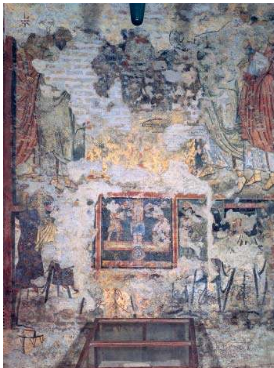
5. Institution de l'Eucharistie et panneau avec les donateurs, troisième quart du XI e siècle, Rome, Santa Balbina.