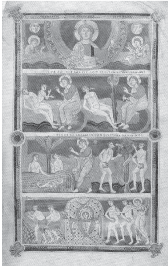
1. Bible du Panthéon, début du XI e siècle, Cité du Vatican, Biblioteca Apostolica Vaticana, Vat. lat. 12958, f. 4v.