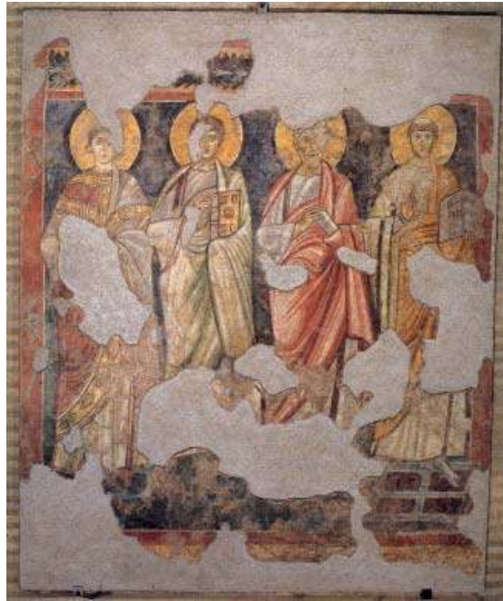
4. Archange et figures de saints, milieu du XI e siècle, Rome, San Lorenzo fuori le mura, chapelle H9.

Sont venues s'ajouter à ces œuvres la Vierge avec une donatrice découverte au baptistère de San Clemente durant les fouilles menées entre 1993 et 1995, que Romano date du troisième quart du XI e siècle (ROMANO, 2006c), précisant ainsi la datation proposée par Guidobaldi, qui penchait pour la fin du siècle (GUIDOBALDI, 1997, p. 475), et la découverte, par Alessandra Acconci, des Quatre archanges peints dans la galerie de la basilique pélagienne de San Lorenzo, datables du deuxième quart