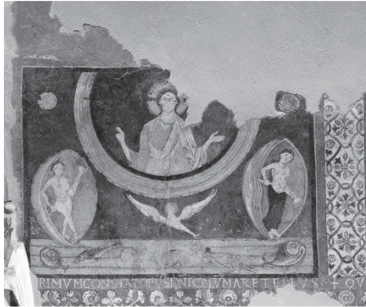
13. Création du ciel et de la terre, vers 1100, Ceri, église de l'Immacolata.

doit être replacé dans le contexte de la réforme et revêt beaucoup d'importance pour la compréhension de la diffusion des thèmes et des styles liés à Rome. Kessler a mentionné à plusieurs reprises ces peintures : il a suggéré d'en avancer la datation et de les rapprocher de celles de San Clemente, datées, avant le Corpus , des environs de 1090, et en tout cas aux alentours du passage au XII e siècle (KESSLER, 2002a, p. 56 ; 2007a, p. 29, note 28) ; nous avons signalé certains éléments graphiques