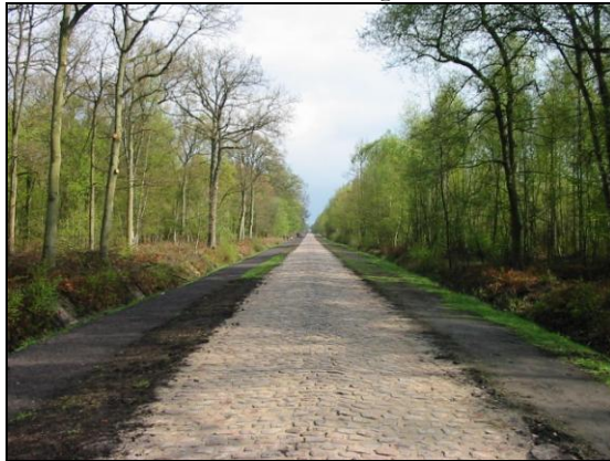
30 avril 2006 : S. Fleuriet