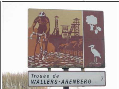
30 avril 2006 : S. Fleuriet