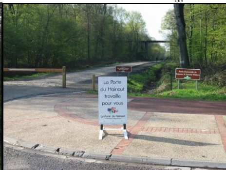
30 avril 2006 : S. Fleuriet