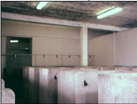
4 octobre 2005 : S. Fleuriet