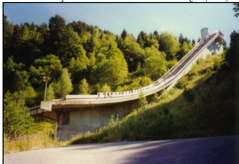
Août 1997. M. Raspaud