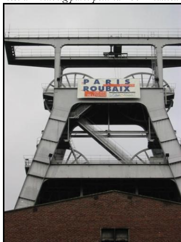
15 avril 2002 : S. Fleuriet