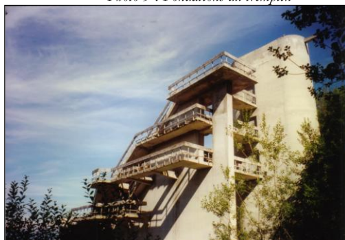
Août 1997. M. Raspaud