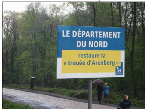
30 avril 2006 : S. Fleuriet