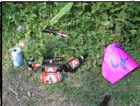
15 avril 2007. S. Fleuriet