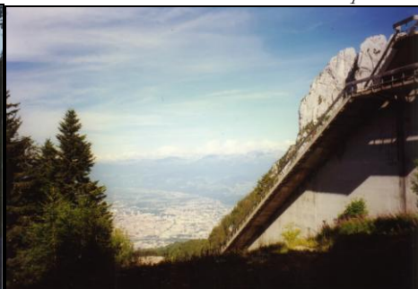
Août 1997. M. Raspaud