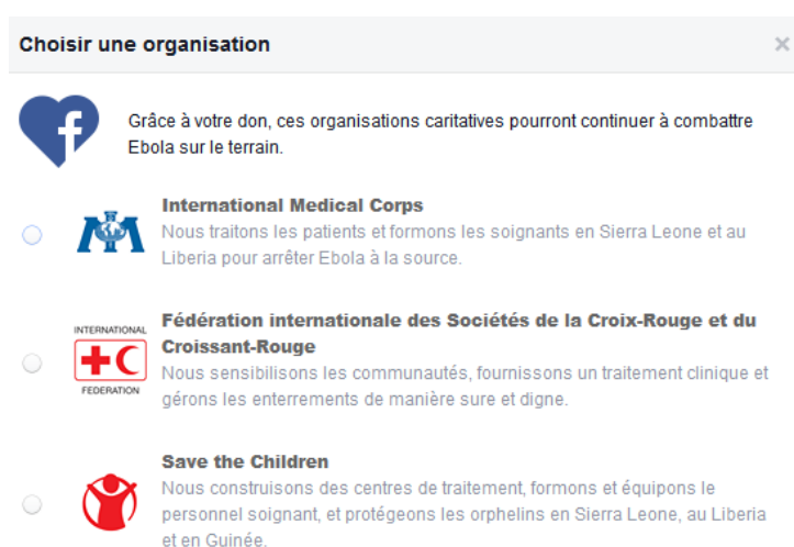
Figure 2 – Appel aux dons de Facebook

Autre triste actualité... Le 4 novembre 2014, Facebook lance un appel aux dons pour lutter contre Ébola.