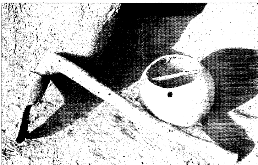
PHOTO 1. — Saxaade (houe à semer) et Ippa-n-rolle (calebasse contenant les graines)