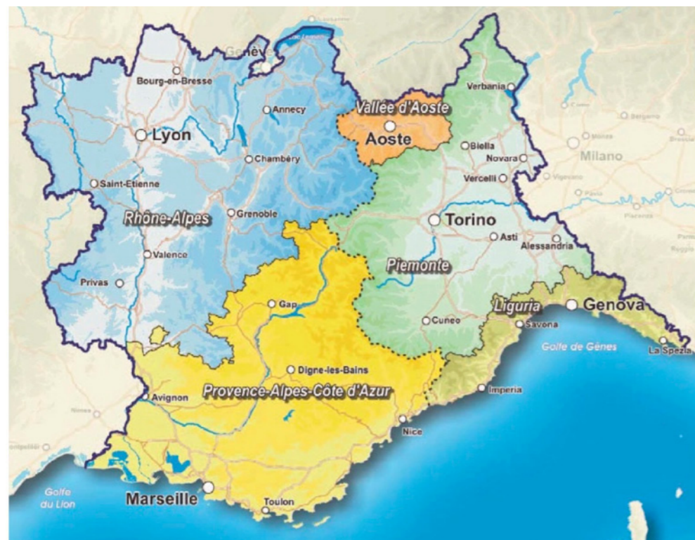
RYŚ. 3. Euroregion Alpy-Morze Śródziemnomorskie