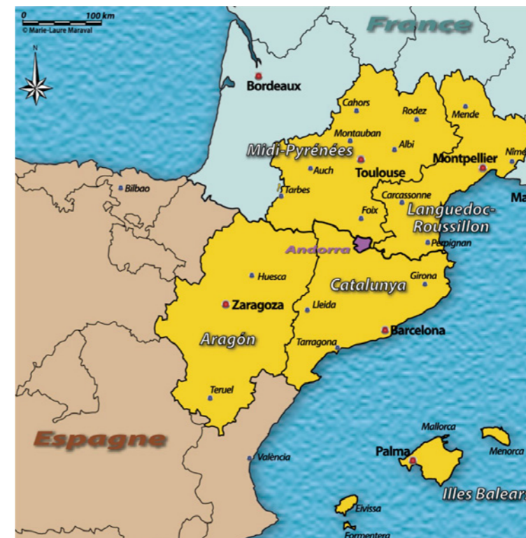
RYŚ. 4. Euroregion Pireneje-Morze Śródziemnomorskie