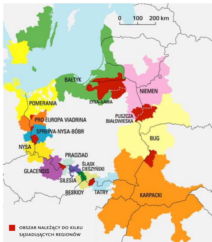
RYŚ. 1. Euroregiony na granicach Polski

(6) Thomas Perrin, Culture et Eurorégions. La coopération culturelle entre régions européennes , Éditions de l'Université de Bruxelles, 2013