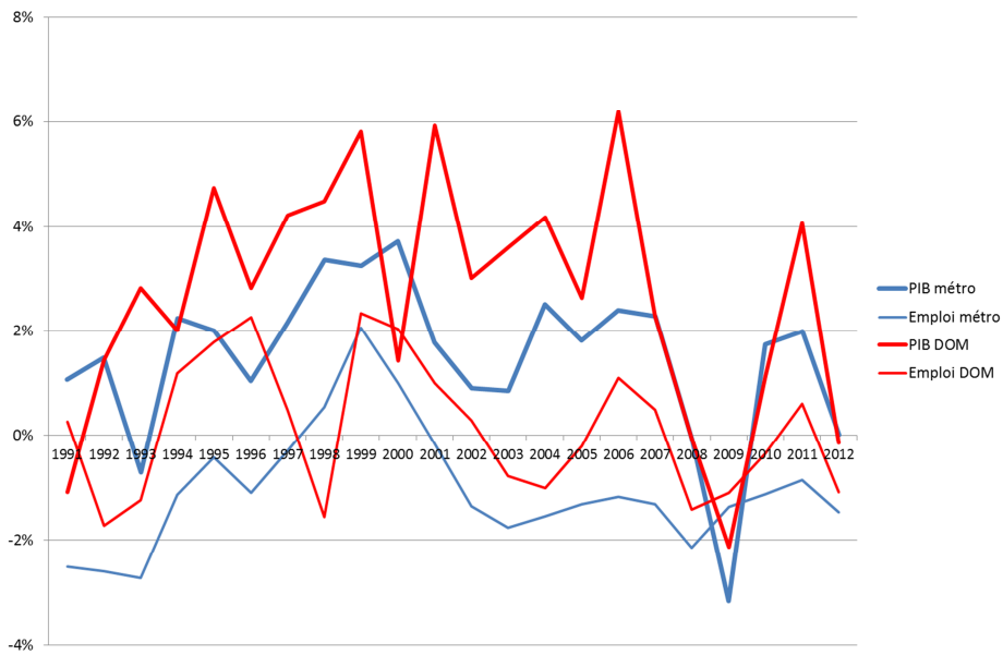
Graphique 1. Croissance du PIB et croissance de l'emploi en métropole et dans les DOM (1990-2012)

Champ : Produit Intérieur Brut, Base 2005, En volume, Prix chaînés, exprimé en taux de croissance.