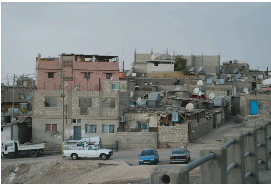
Figure 5: Le quartier de Shallaleh – Aqaba

Au regard de l'insalubrité de l'habitat dans ce quartier, les pouvoirs publics locaux n'ont pas eu de mal à justifier sa démolition, en mettant en avant l'objectif « (d') assainir le centre-ville, de lutter contre le trafic de drogues et le développement de la prostitution dont Shallaleh est l'un des foyers principaux 40 ». Cette opération a aussi été l'occasion pour l'A.S.E.Z.A. d'identifier et de contrôler les résidents actuels de ce camp informel de réfugiés palestiniens. Si le transfert de la population n'a pas fait naître de tensions sociales, cette stratégie de légitimation par la stigmatisation s'est heurtée, en revanche, au mécontentement et à la mobilisation d'environ une centaine d'habitants du quartier. Après avoir organisé une pétition, ils ont déposé une requête auprès des instances juridiques, afin d'obtenir réparation des préjudices.