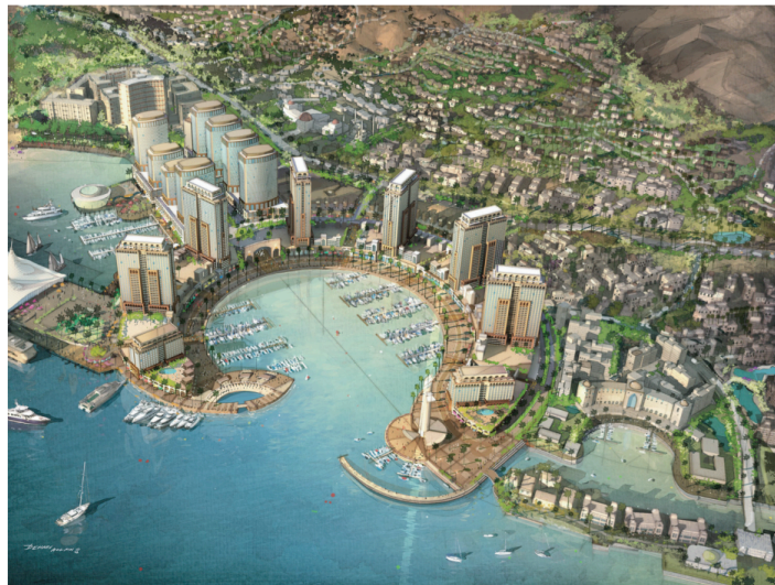
Figure 3: Le projet Marsa Zayed (2) – Aqaba

Cet urbanisme contraste totalement avec le reste de la ville, autant par son programme et ses destinataires, que par son architecture et son organisation urbaine. Saraya Aqaba apparaît comme une entité urbaine, en quelque sorte « déterritorialisée », issue d'un processus de fabrication de la ville ex-nihilo en rupture avec le tissu urbain existant. La forme urbaine et l'architecture mises en œuvre participent des valeurs et des images portées par ces actions urbaines et en deviennent symboliques. Le gigantisme, l'ostentation et l'opulence seront privilégiés à travers la forte verticalité des tours, une architecture singulière, signée par des « archi stars » et des espaces résidentiels d'exception caractérisés par l'horizontalité et un riche traitement paysager.