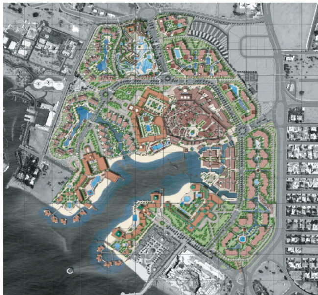
Figure 2 : Plan masse du projet Saraya Aqaba, (source : Saudi Oger)

Le complexe de Saraya Aqaba (fig. 2) mis en œuvre à la périphérie Ouest est une sorte de ville à part entière de 63,4 ha qui prolonge le front de mer aqabiote de plus d'un kilomètre. Il comprend un secteur hôtelier de haut standing (6 hôtels de 4 et 5 étoiles) développé autour d'un lagon artificiel connecté au golfe d'Aqaba ; un secteur résidentiel (appartements et villas) inscrit dans des espaces verts encadrant le complexe ; une reproduction de la vieille ville arabe, avec les attributs traditionnels, tels qu'un souk, des bains turcs et des hammams, des lieux touristiques modernes (restaurants, commerces, théâtre, musée, galerie d'art, centre de conférences et bureaux) et enfin un parc aquatique qui constitue un endroit potentiellement accessible par une clientèle non résidente.