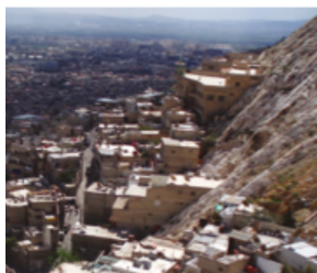
Damascus - Qassioun