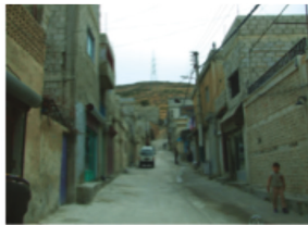
Damascus - Boustan Al-Riz