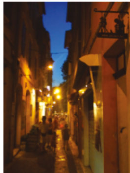
Antibes, Côte d'Azur - France