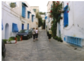
Tunis, Sidi Bou Saïd - Tunisia