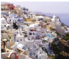
Santorin - Greece