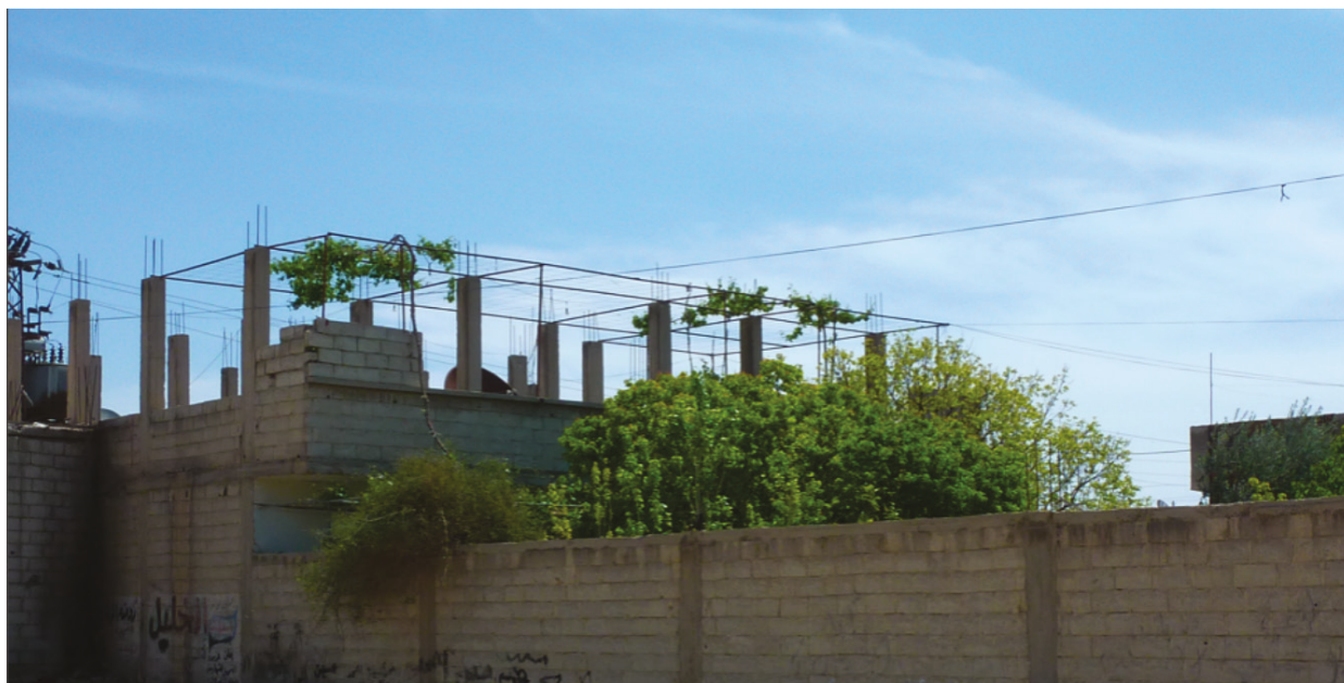
Les habitants verdissent des toitures (vigne), quartier informel de Bahdaliéh, Damas.

L'adaptation au changement climatique dans ces quartiers peut également tirer parti des aspects positifs du réchauffement en diminuant les dépenses. Par exemple, l'augmentation des jours ensoleillés rend plus efficace et rentable la mise en place de panneaux solaires et surtout de chauffe-eaux solaires.