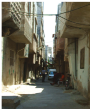
Damascus - Sbeineh