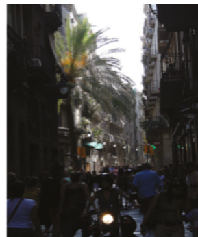
Barcelona, Barceloneta - Spain

Une morphologie et des tissus urbains de quartiers informels de Damas comparables à ceux d'espaces urbains méditerranéens remarquables d'échelles variées.