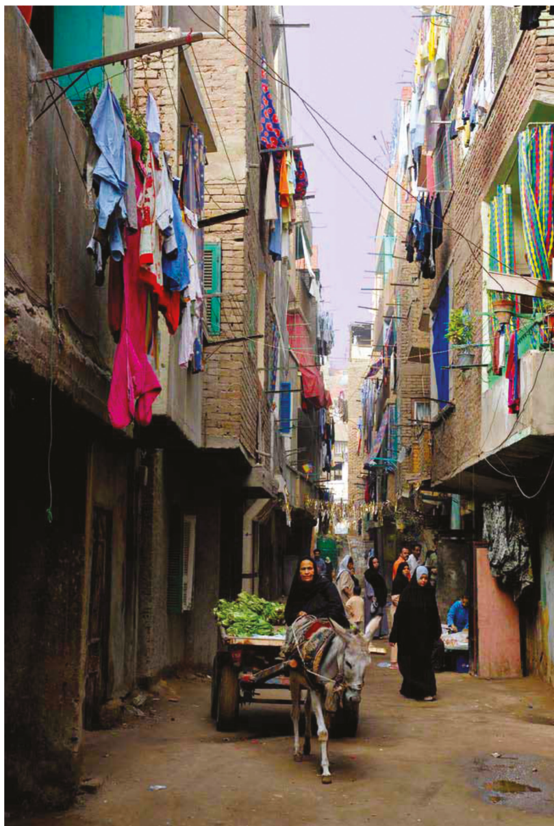
Rue étroite, densité, faible trafic, quartier de Boulaq el-Zahrou, Le Caire

ces quartiers à une moins bonne protection juridique et financière.