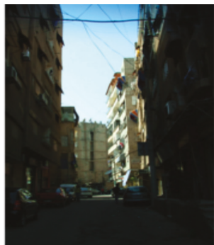
Damascus - Mezzeh 86