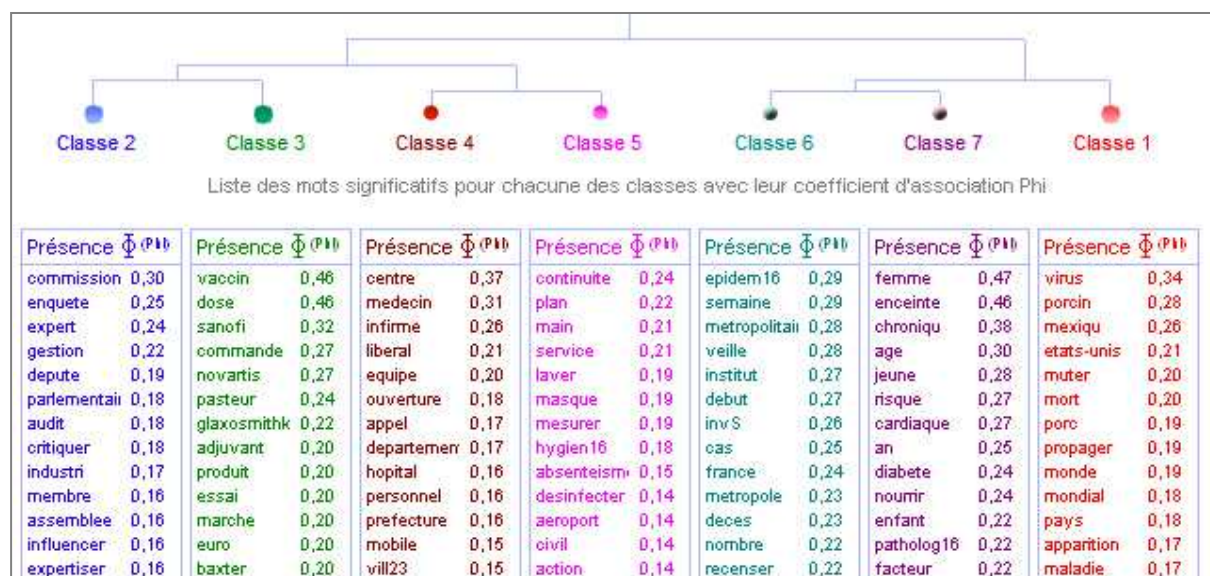
Figure 1: Éléments de définition des mondes lexicaux pour le corpus. Arbres de classes issus des traitements Alceste.

La « population à risque et à vacciner » est regroupée dans la classe 7 : enfants , femmes enceintes , jeunes , personnes âgées , personnes porteuses de pathologies cardiaques et diabétiques .