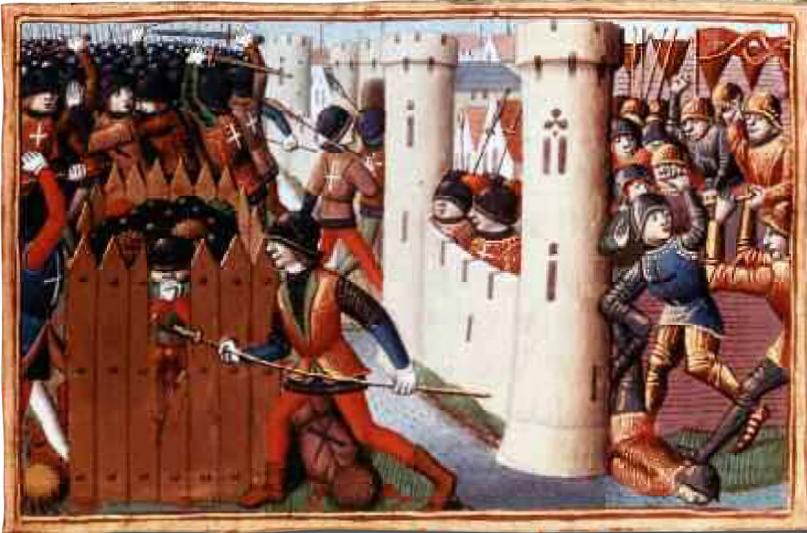
Jeanne d'Arc. Miniature tirée de « La vie des femmes célèbres » d'Antoine Dufour, 1505 environ. (Nantes, musée Thomas)