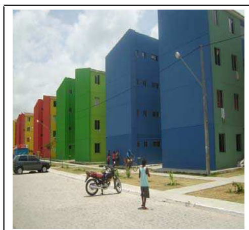
Figura 02: Conjunto Habitacional Via Mangue III

Para tratarmos dos impactos urbanísticos e sociais das comunidades realocadas a partir do projeto Via Mangue optamos desenvolver esta pesquisa no primeiro habitacional construído através do projeto, o Conjunto Habitacional Via Mangue III ( Figura 02 ), para onde foram realocadas as famílias da comunidade Xuxa e parte das famílias de Deus nos Acuda. O Via Mangue III foi entregue em 2010, possuindo 352 apartamentos, distribuídos em 11 blocos. Procuramos verificar em que medida tal política promoveu uma melhoria significativa das condições de habitabilidade ou a mera inclusão precária dessas populações. Para isso, realizamos visitas a campo e aplicamos entrevistas semi-estruturadas com os membros das comunidades Xuxa e Deus nos Acuda.