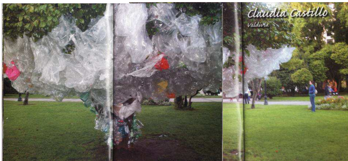
“Un Árbol, Un Artista”