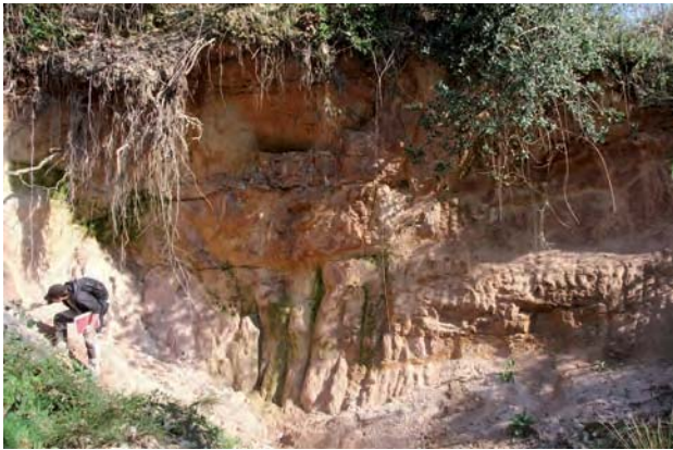
3. Bibracte, Mont Beuvray. Les matériaux de construction de la romanisation. Vue du front de taille de la carrière de Charconnet (commune de St-Léger-sous-Beuvray).

Saint-Légersous-Beuvray. L'affleurement visible correspond à du sable ayant une puissance stratigraphique d'environ quatre mètres (ill.3) et il repose directement sur le substrat qui est ici le granite rose à deux micas. Ce sable est ici ce que nous appelons une arène granitique, c'est-à-dire un sable grossier issu de l'altération sur place du granite qui constitue le substrat (Foucault, Raoult 2010). Cette couche sédimentaire détritique meuble doit donc posséder toutes les caractéristiques minéralogiques du granite rose à deux micas dont elle est issue. L'analyse de ce sable (ill. 4) permet en effet d'observer qu'il est constitué de quartz, de feldspaths, de grains de muscovite plurimillimétriques et de fragments de granite rose à deux micas. Les grains observés ont une taille qui varie du silt au gravier et ils sont sub-anguleux. Cette description est tout à fait semblable aux constituants grossiers présents dans les matériaux de types de pâte n° 5 et n° 8.