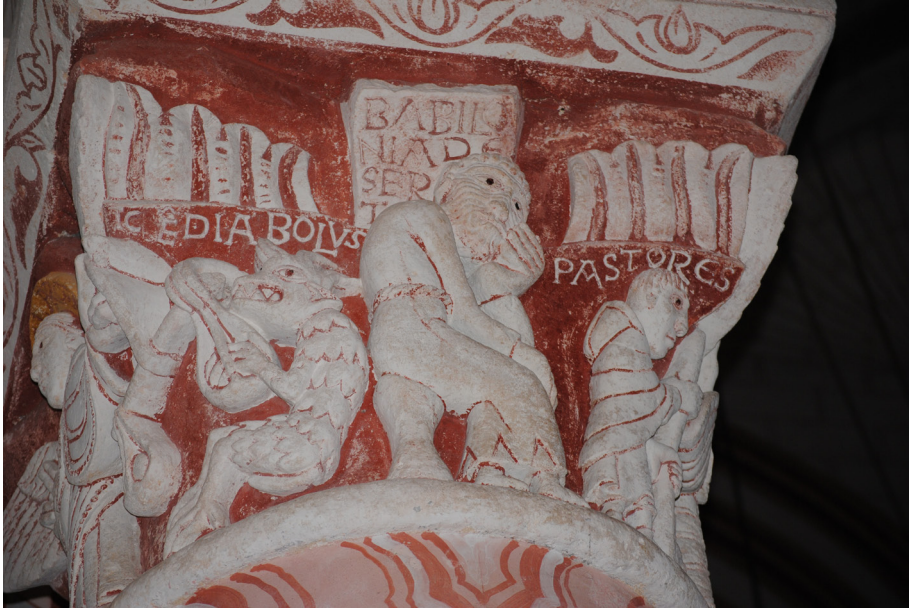
Fig. 1. Chauvigny, église Saint-Pierre, chapiteau du rond-point, face est.