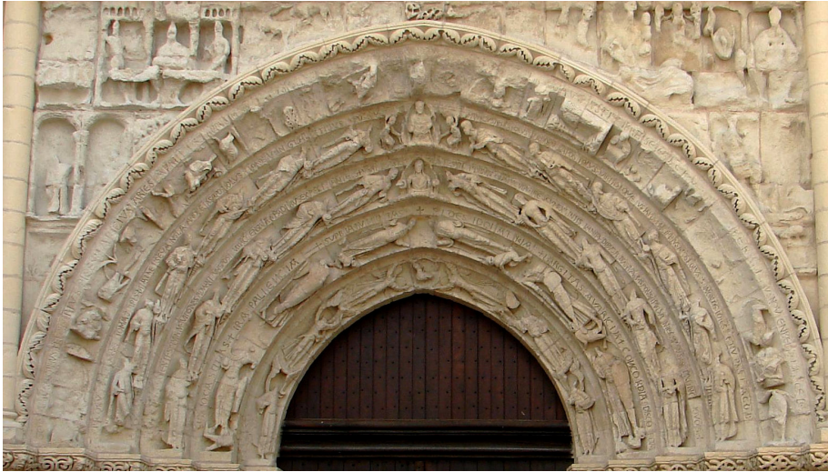
Fig. 5. Argenton-les-Vallées, église Saint-Gilles, portail occidental, tympan.