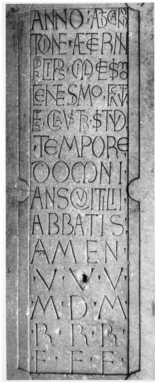
Fig. 7. Moissac, abbaye Saint-Pierre, cloître, mention de construction.