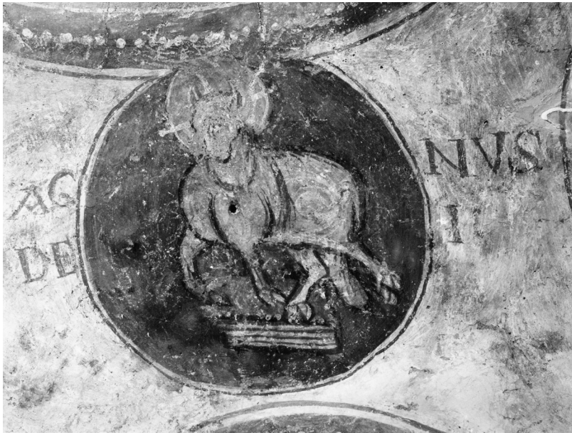
Fig. 2. Poitiers, église Notre-Dame-la-Grande, crypte, Agnus Dei .