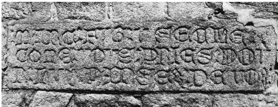
Fig. 3. Quimper, cimetière, inscription funéraire de Marc.