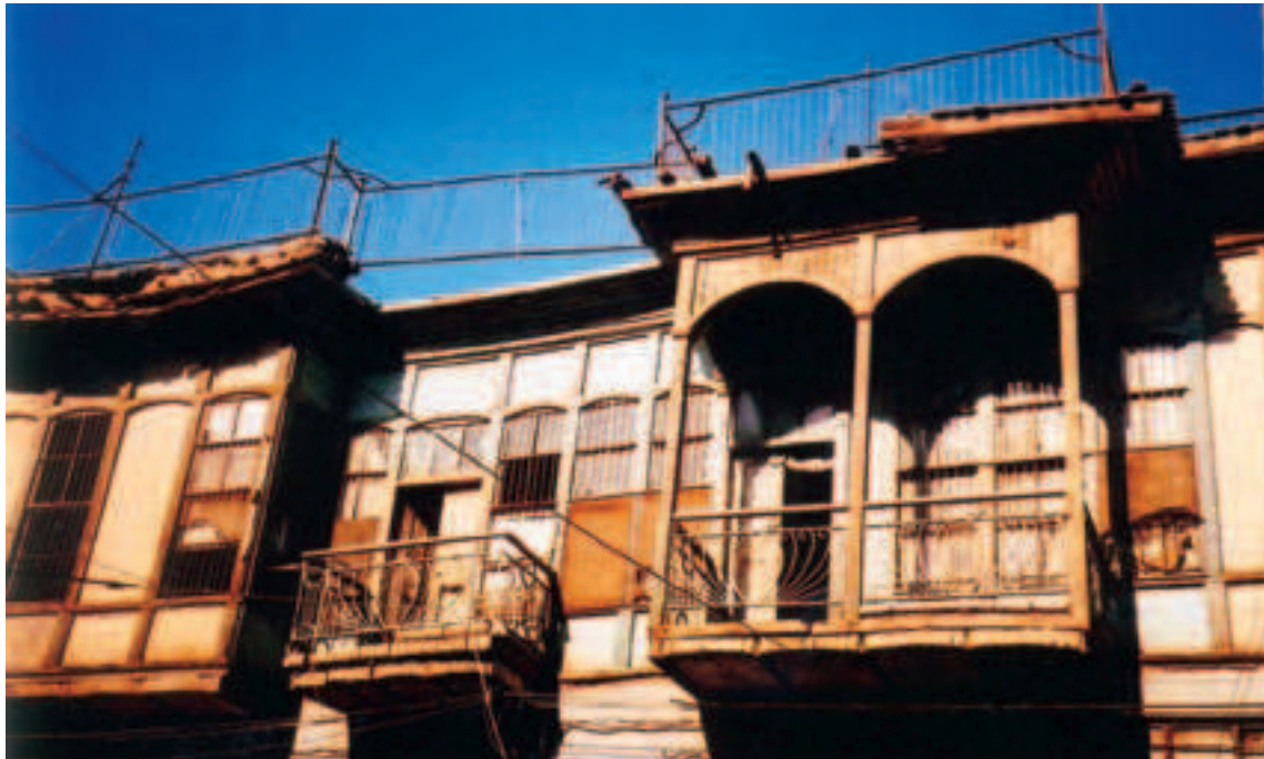
Fig. 3. Bagdad (Irak), quartier Battaween, façade transitionnelle type, 1920-1936.