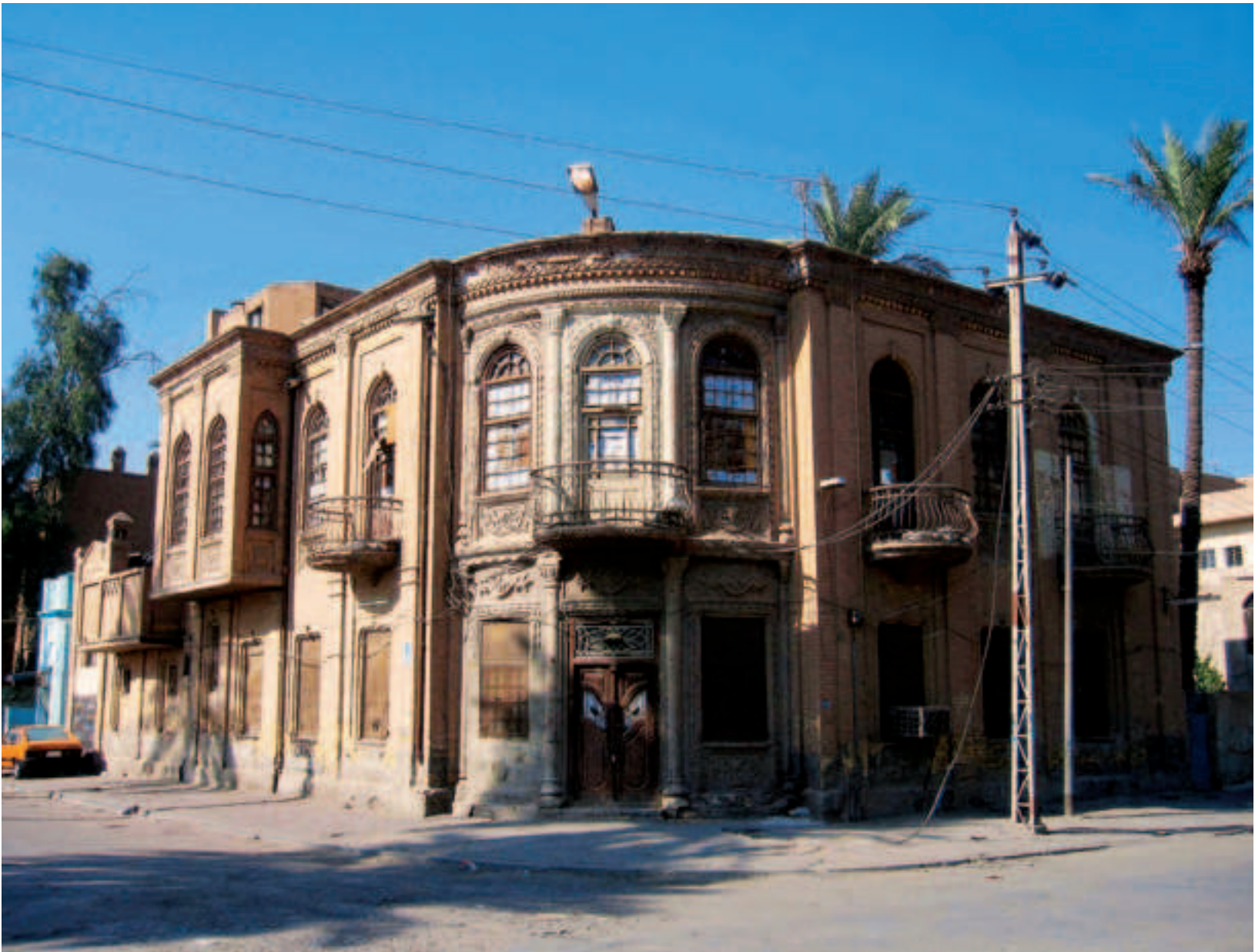
Fig. 1. Bagdad (Irak), quartier Alwaziya, demeure bourgeoise, 1933 : façade donnant sur la rue, jardin à l'arrière, plan centré autour d'un hall couvert circulaire, décor composite en brique.