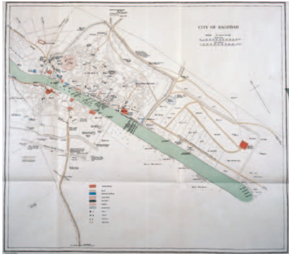
Fig. 2. (a) Bagdad (Irak), une rue dans un quartier en damier, Karrada. (b) Bagdad (Irak) en 1917 (détail) et (c) en 1929 (détail) ; en 1917, l'ancienne enceinte délimite encore la forme de la ville ; en 1929, les zones déjà bâties par les Britanniques (en grisé) ont été gagnées sur palmeraies et vergers (cartes inédites, Londres, National Archives).