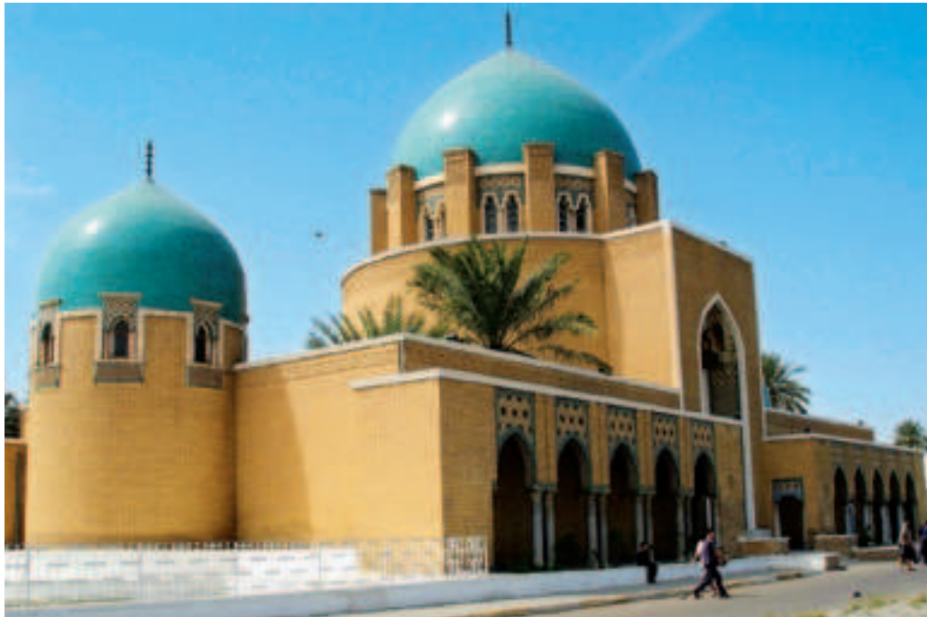
Fig. 7. Bagdad (Irak), Cooper, quartier Adhamiya, mausolée de Fayçal I er , 1936. Syncrétisme entre tradition monumentale funéraire islamique et stylisation art déco.

La brochure officielle évoque « la synthèse de l'apport de l'Irak à la civilisation [...] une réminiscence des fameux jardins suspendus de Babylone et en même temps un rappel d'une architecture qui s'est propagée au Moyen Âge jusqu'en Espagne », insistant sur « l'immense porte aux vantaux rouges [...] flanquée de deux lions ». Dans ce texte d'un apologétique au demeurant sans surprise, aucun détail n'est laissé au hasard : monumentalité renvoyant à une Antiquité grandiose, référence à un passé prestigieux et à un rayonnement international, tout concourt à servir une rhétorique nationaliste pour ce pays qui, paradoxalement, s'affirme jeune et tient à se frayer une place autonome dans le concert des nations. Plus loin, le texte est davantage explicite encore :