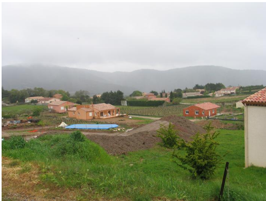
Photo n°1 : Mosaïque de vignes et de maisons individuelles récentes en ordre dispersé au Pradal (avril 2008), commune du PNR du Haut-Languedoc dotée d'une simple carte communale.