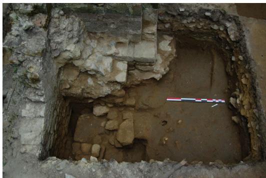
Fig. 2 - Saint-André-des-Eaux, vue de l'autel secondaire depuis l'ouest.