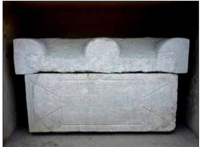
Fig. 1 - Sarcophage à acrotères d'Alethius devant la mairie de Charmes-sur-Rhône

Une campagne de prospection sur la commune et l'étude de lots de mobiliers, récupérés lors de divers travaux d'aménagements grâce aux soins d'érudits locaux, ont permis de préciser les informations disponibles et de définir un faciès céramique pour ces occupations de la fin de l'Antiquité.