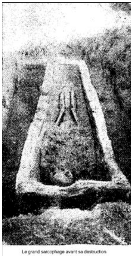
Fig. 2 - Sépulture trapézoïdale, découverte en 1934. Quartier de la Gare.

Sur le plateau des Ménafauries, on reconnaît plusieurs occupations. Une première fouille en 1984 a révélé une dizaine de tombes