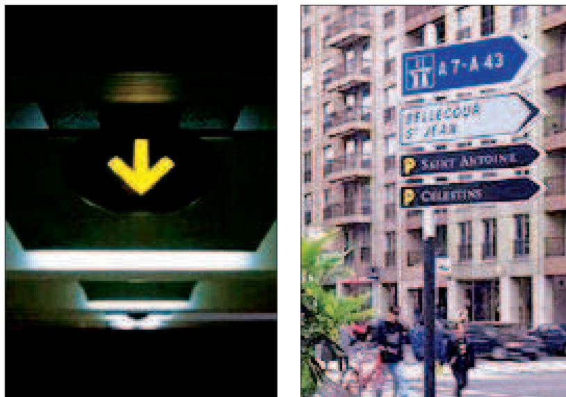
FIGURES 3 et 4.

L'identité d'une fonction urbaine: signalétique intérieure et extérieure, par Yan D. Pennor's